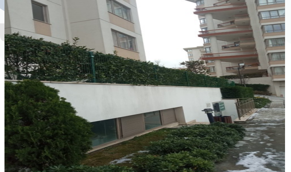
B1 BLOKTA PEYZAJINDA FIRTINADAN HASAR GÖREN ÇİTLER ONARILDI.