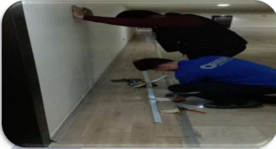
Bina geneli eşik çita kontrolleri gerçekleştirilmiştir.