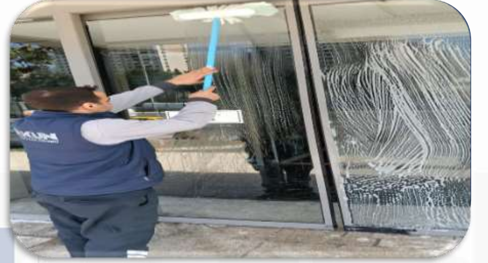
Blok giriř kapılarının temizliđi gerekleřtirilmiřtir.