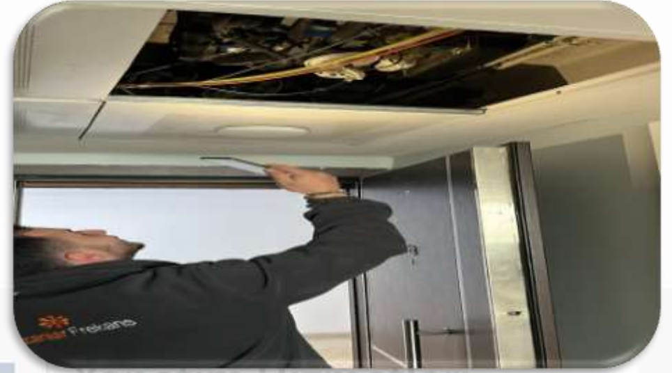
Frekans Enerji sayaç periyodik bb sayaç kontrolleri gerçekleştirilmiştir.