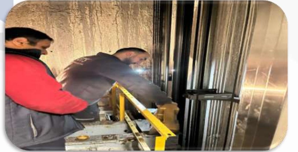
Asansörlerin aylık bakım faaliyetleri gerçekleştirilmiştir.