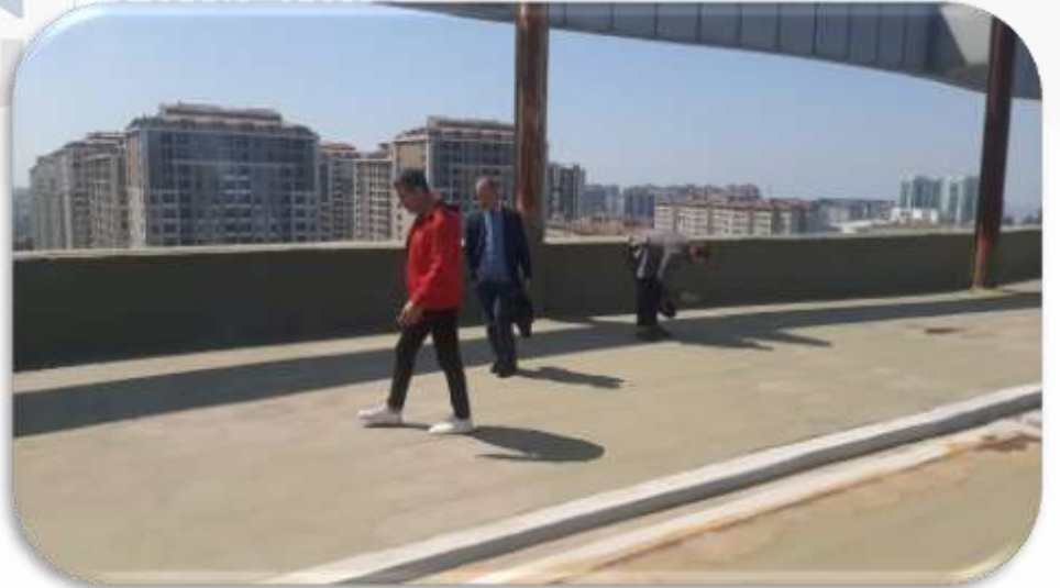
Çatı teras izolasyon kontrolleri gerçekleştirilmiştir.