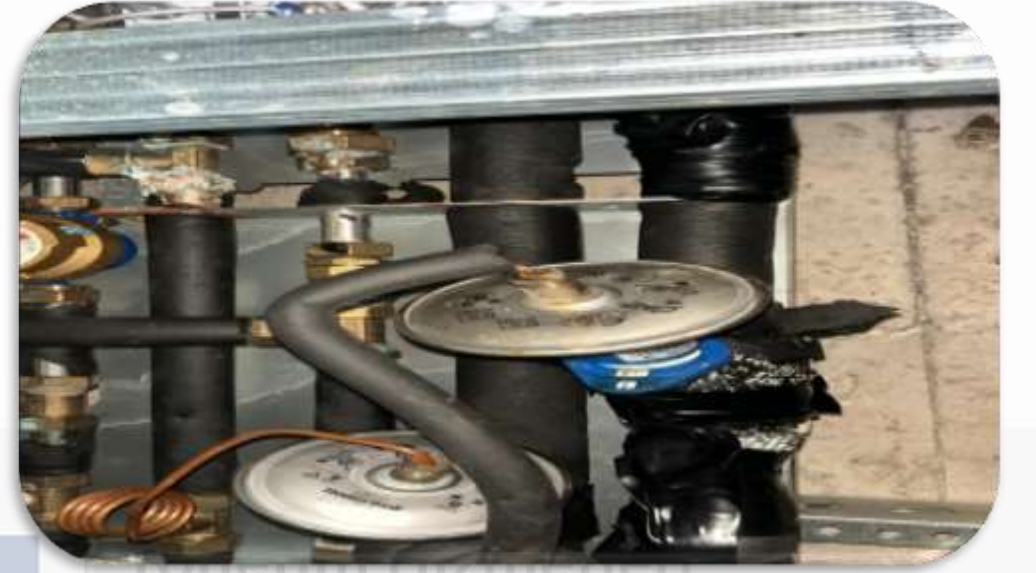
Bb sayaç izolasyon kontrolleri gerçekleştirilmiştir.