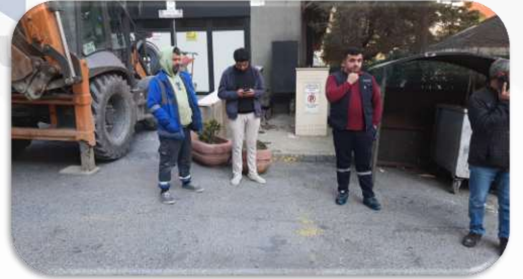
İski yetkili personellerince saya kontrolleri gerekleŒtirilmiŒtir.