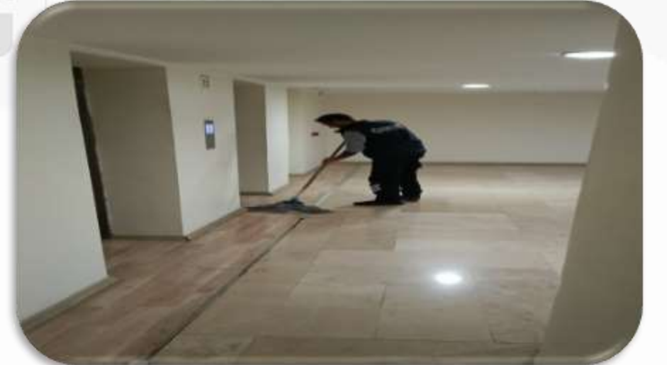
Bina geneli zemin temizliđi gerekleřtirilmiřtir.