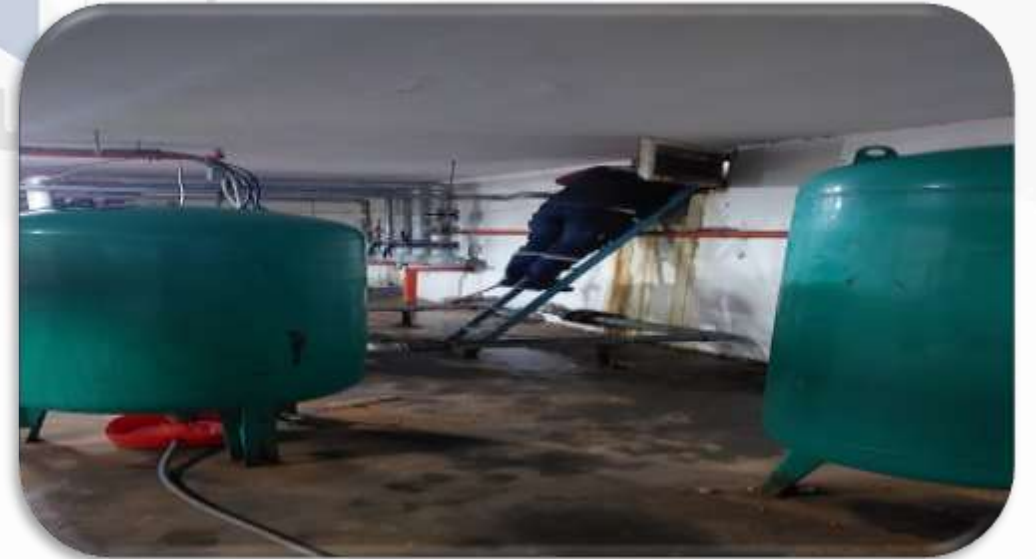
Su deposu kontrolleri gerçekleştirilmiştir.