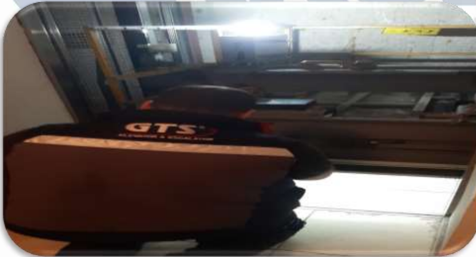
B Blok sağ asansör kapı arızası giderilmiştir.