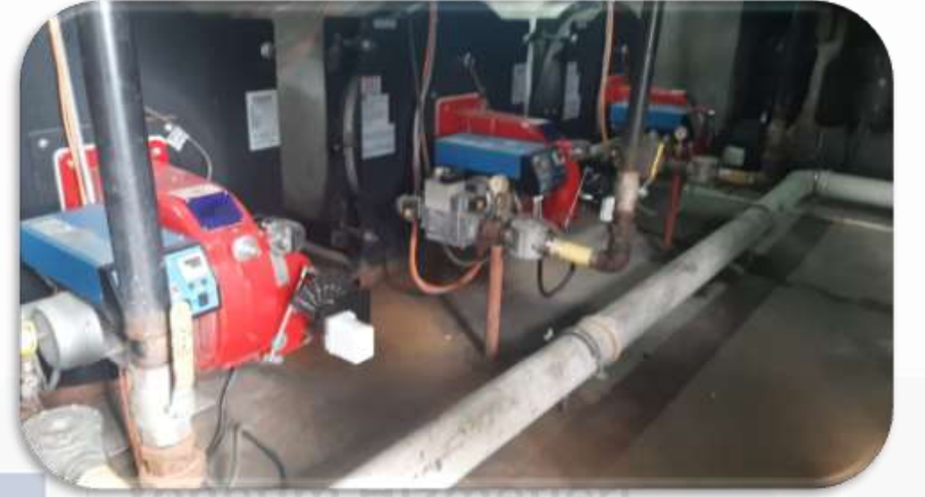
Isıtma sistemi periyodik kontrolleri gerekleŒtirilmiŒtir.

➤ Bina geneli ortak alan aydınlatma kontrolleri gerekleŒtirilmiŒtir.