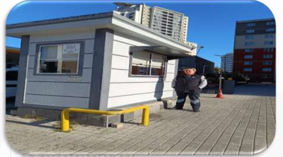
Gayrimenkul Güvenlik Tesisleri

➤ Eşya taşımaları bizzat güvenlik görevlileri ve güvenlik personeli tarafından takip edilmekte ve taşınma işlemlerinde gerekli tüm tedbirler alınmaktadır.