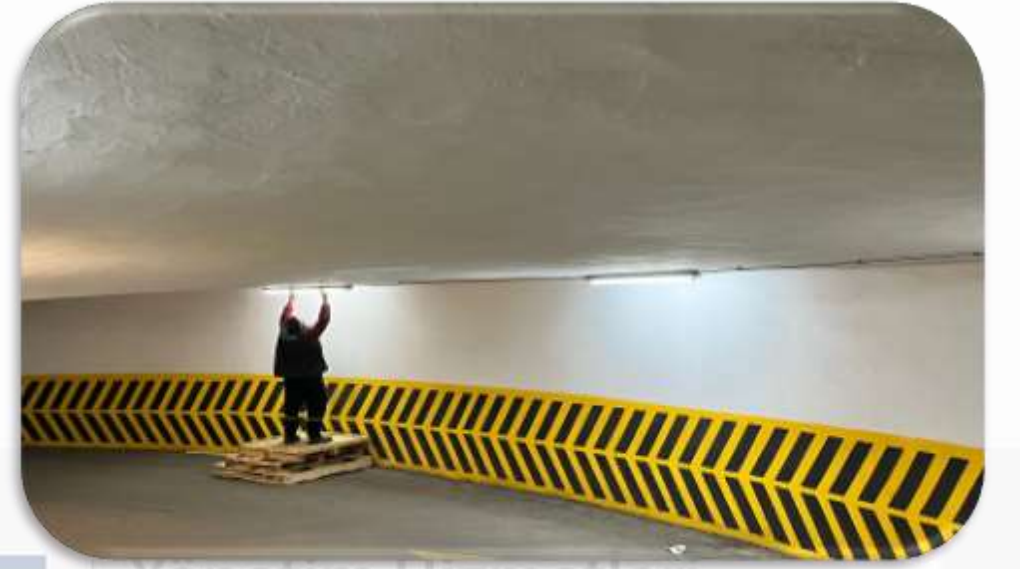
Kapalı otopark aydınlatma kontrolleri gerçekleştirilmiştir.