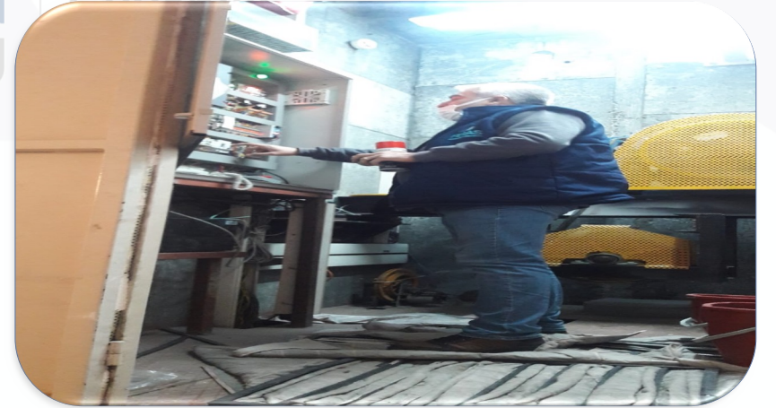
Asansörlerin aylık bakım faaliyeti gerçekleştirilmiştir.