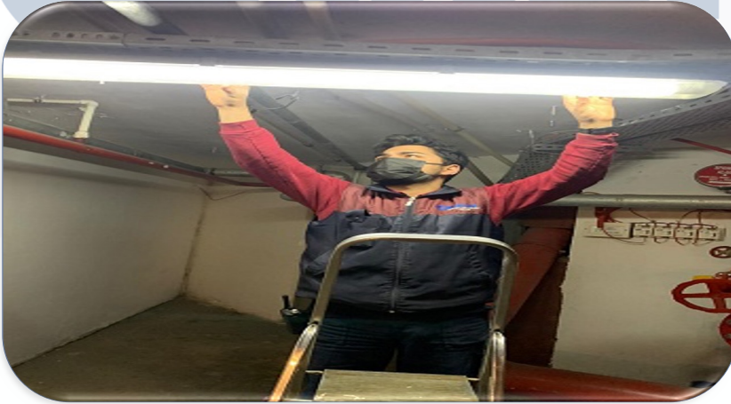
Bina geneli aydınlatmaların hasar kontrolleri gerçekleştirilmiştir.