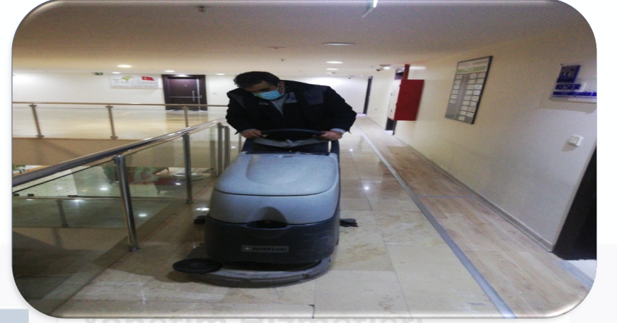
Bina geneli ortak alan koridor zemin temizliği gerçekleştirilmiştir.