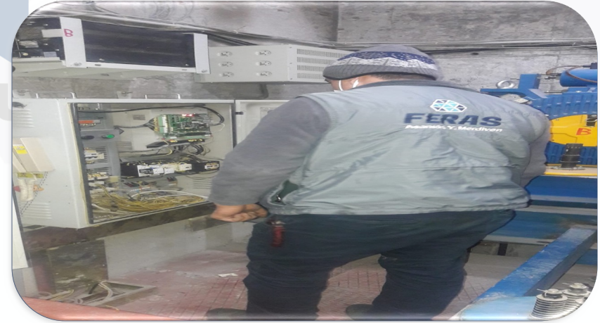
A Blok sağ asansörünün arızalı 6 adet kart rölesi yenileri ile değiştirilmiştir.