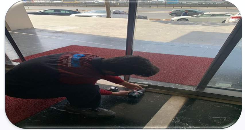
B blok lobi giriş kapısının mekanik aksan arızası giderilmiştir.