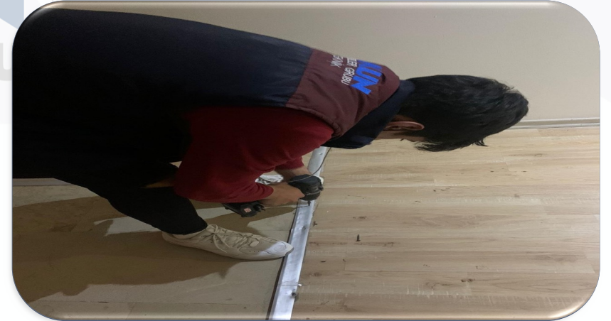
Bina geneli süpürgeliklerin hasar kontrolleri gerçekleştirilmiştir.