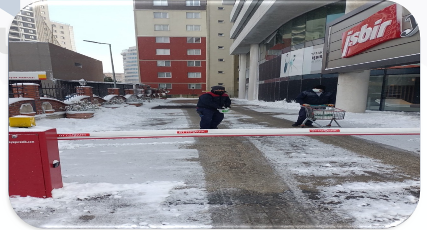
Yoğun kar yağışı dolayısı ile otopark ve bina giriş çıkışlarına kar tuzu uygulanmıştır.