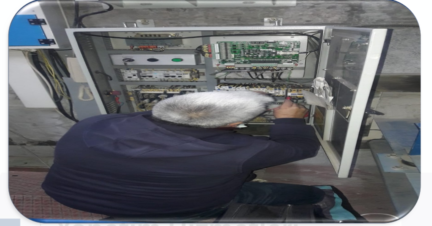
B Blok yük asansörünün arızalı fotoseli yenisi ile değiştirilmiştir.