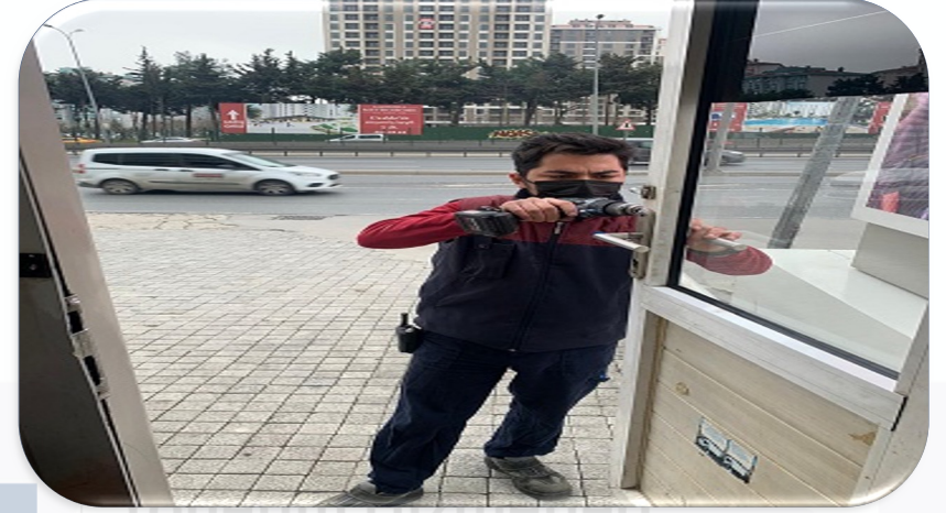
Güvenlik kabini arızalı kilit takımı yenisi ile değiştirilmiştir.