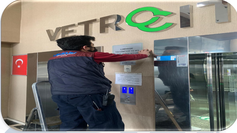
Lobi asansör önlerindeki yırtık duvar kağıtları yenilenmiştir.