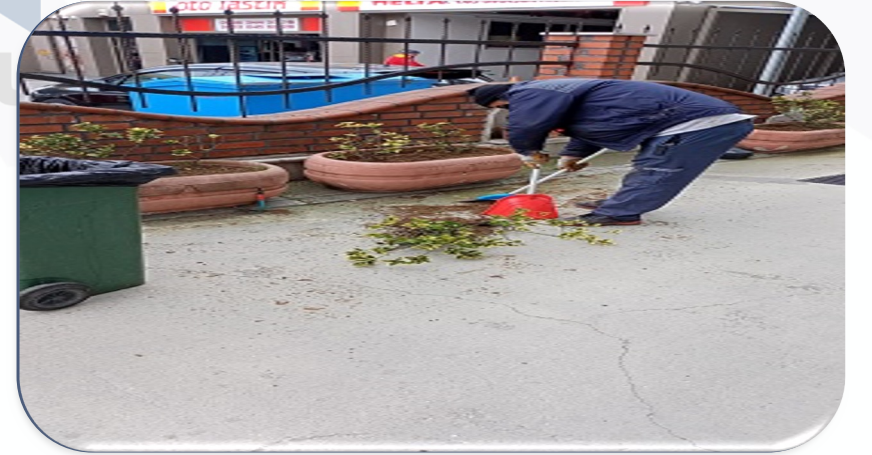
İç ve dış mekan bitkilerin periyodik kontrolleri gerçekleştirilmiştir.