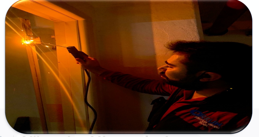
-4 kapalı otopark katındaki yangın çıkış kapısının kırık menteşesi kaynak işlemi ile yerine sabitlenmiştir.