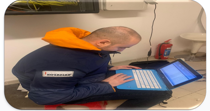
Yönetim Hizmetleri Gayrimenkul Aylık fatura paylaşımı için sayaç okuma hizmeti alınmıştır.