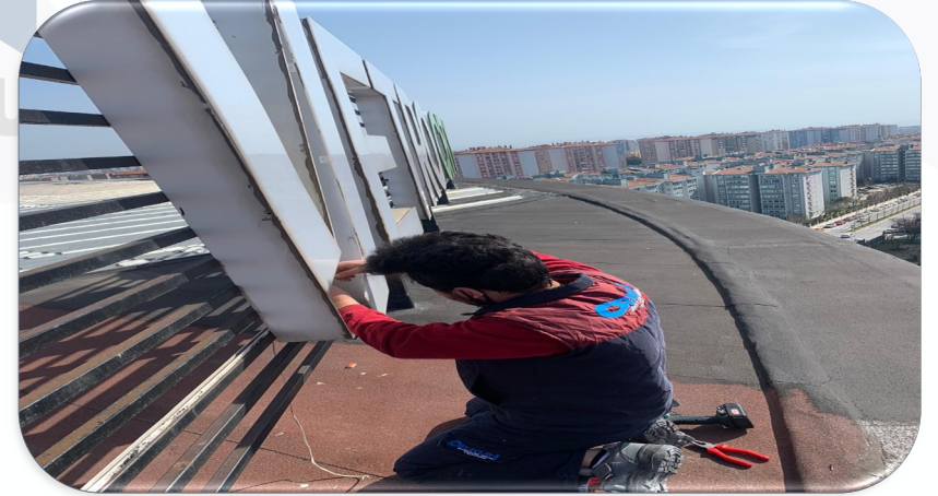
A Blok çatıdaki Vetro City ışıklı tabelasının kablo bağlantıları yenilenmiştir.