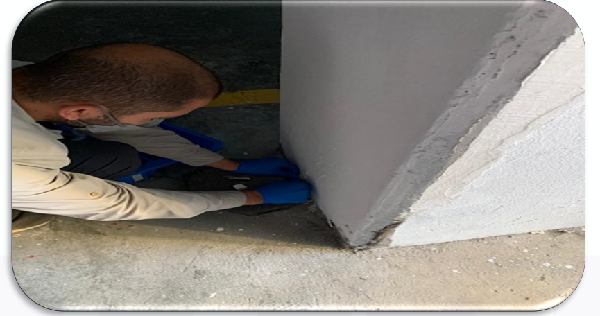
Yönetim Hizmetleri Gayrimenkul Periyodik ortak alan ilaçlama faaliyeti gerçekleştirilmiştir.