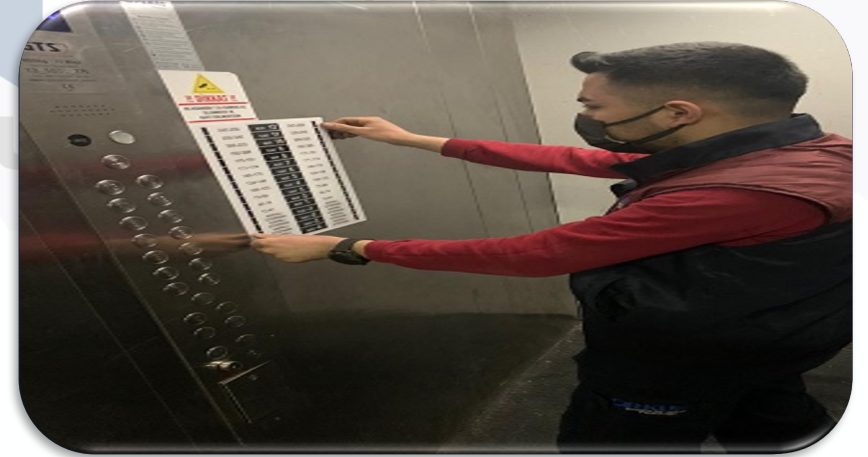
Asansör içlerindeki bb-kat gösterge levhalarının hasar kontrolleri gerçekleştirilmiştir.