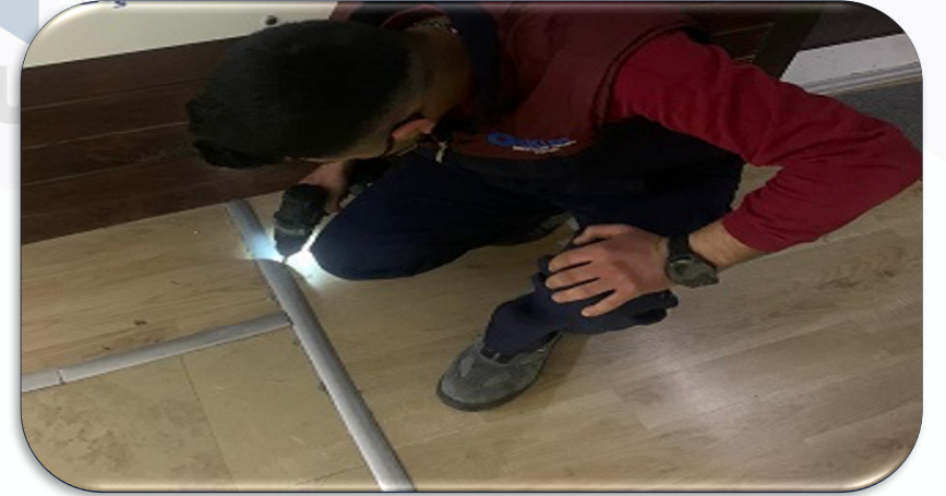
Bina geneli süpürgeliklerin hasar kontrolleri gerçekleştirilmiştir.