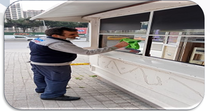
Güvenlik kabini temizliği gerçekleştirilmiştir.