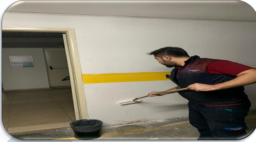
Kapalı otopark duvarları boyanmıştır.