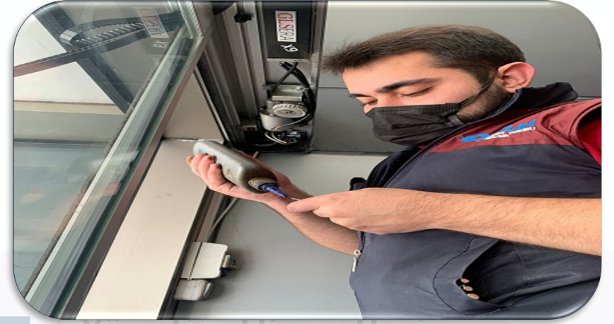
B Blok giriş kapısının arızalı motor dişlisi yenisi ile değiştirilmiştir.