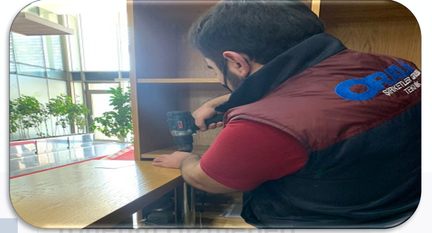
Lobilerin ses kayıt cihazları yenilenmiştir.