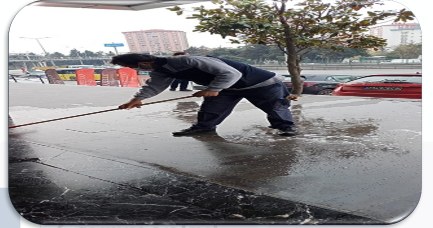
Bina giriş alanı yıkanmıştır.