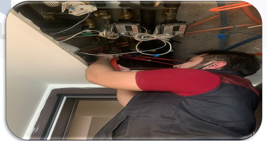
BB teknik servis talepleri karşılanmıştır.