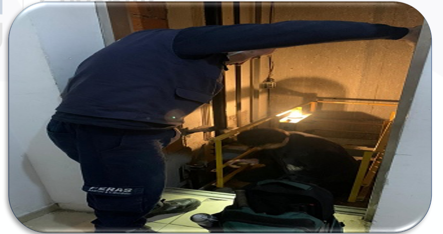
Asansörlerin aylık bakım faaliyeti gerçekleştirilmiştir.