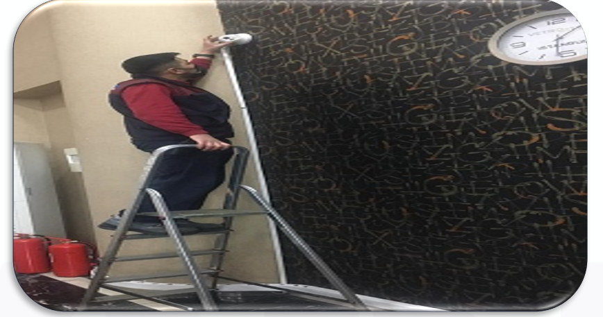
Kamera sistemi periyodik kontrolleri gerçekleştirilmiştir.