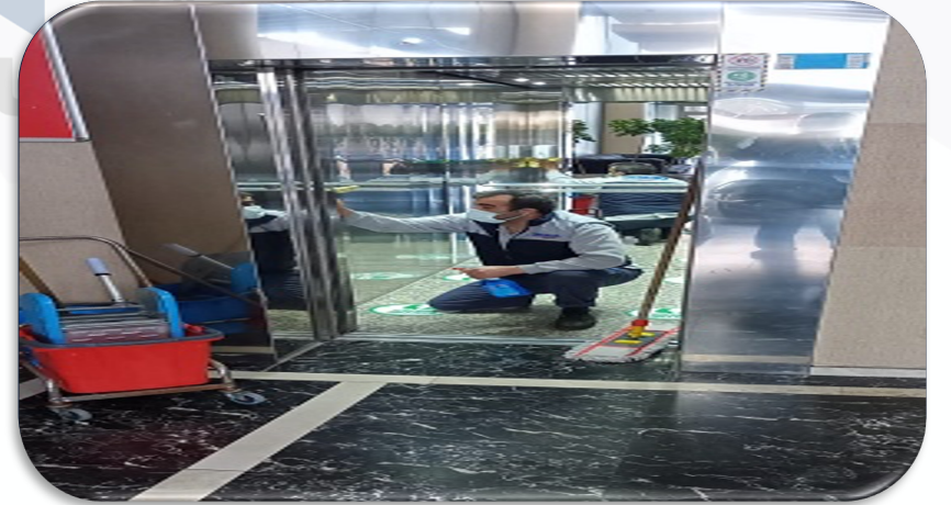
Asansörlerin kabin ii temizliđi gerekleřtirilmiřtir.