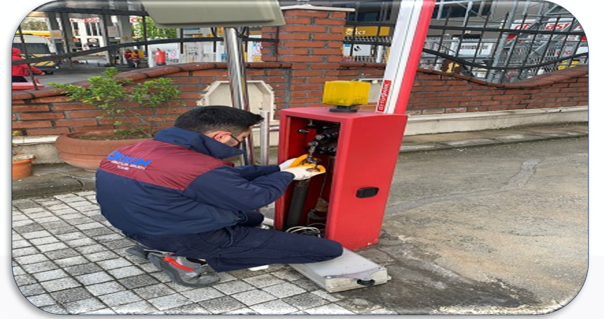
Turnike sistemi periyodik kontrolleri gerçekleştirilmiştir.