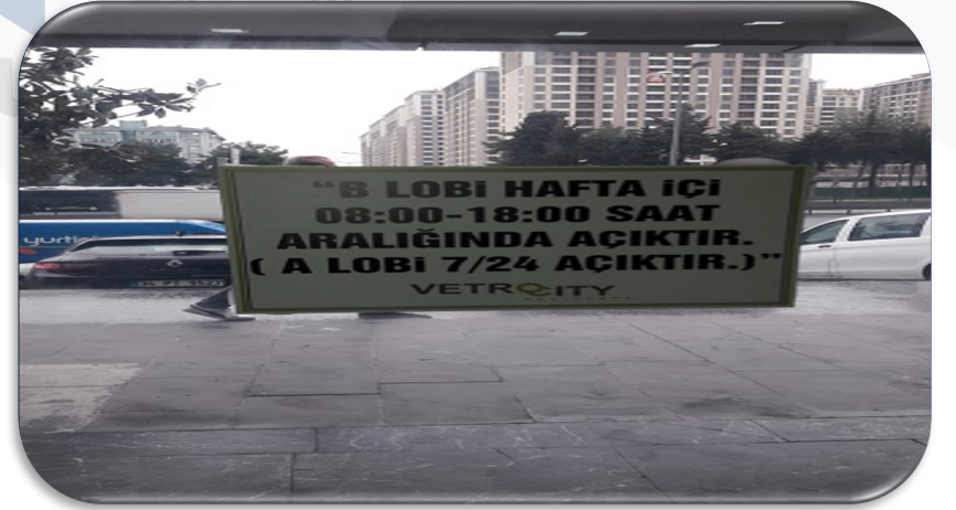
Ortak alan uyarı levhaları yenilenmiştir.