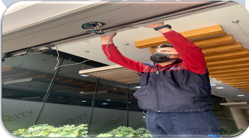
A Blok giriş kapısının arızalı radarı yenisi ile değiştirilmiştir..