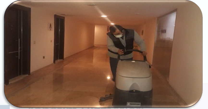
Bina geneli ortak alan koridor zemin temizliđi gerekleřtirilmiřtir.