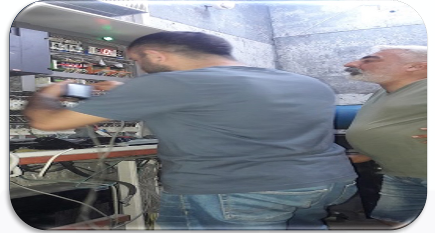
B Blok yük asansörünün yazılım arızası giderilmiştir.