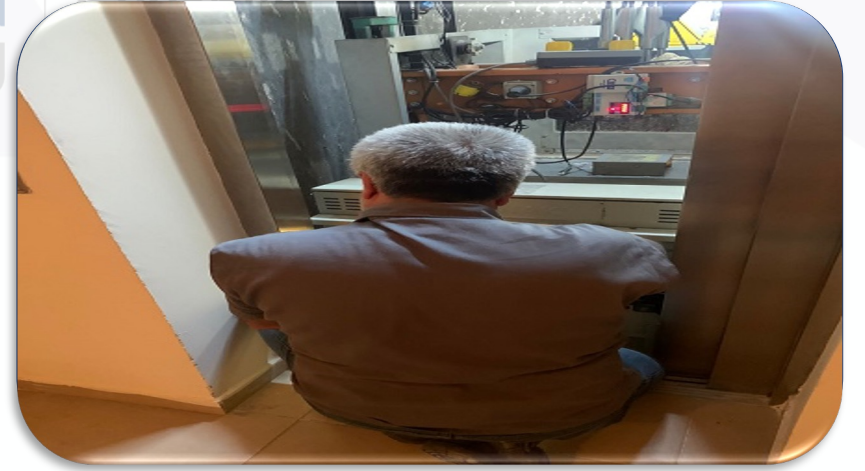
Asansörlerin aylık bakım faaliyeti gerçekleştirilmiştir.