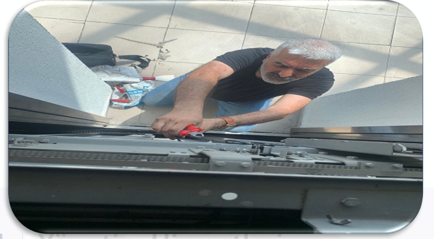
A Blok sağ asansörünün arızalı fotoseli yenisi ile değiştirilmiştir.