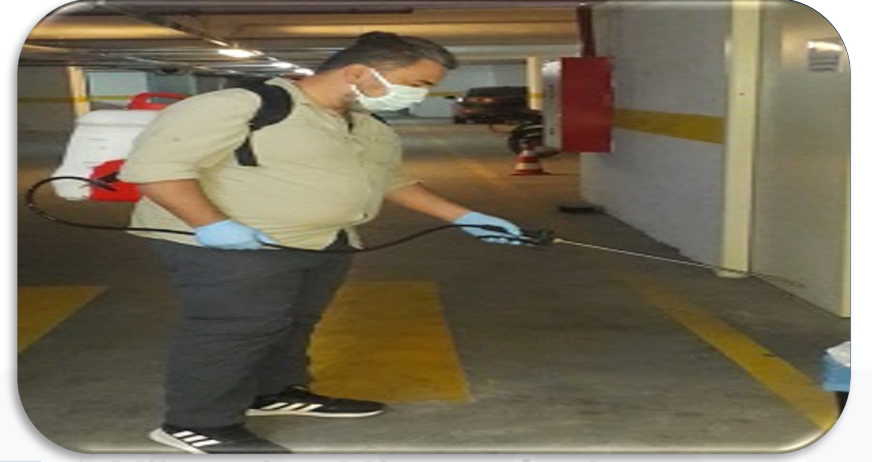
Periyodik ortak alan ilaçlama faaliyeti gerçekleştirilmiştir.