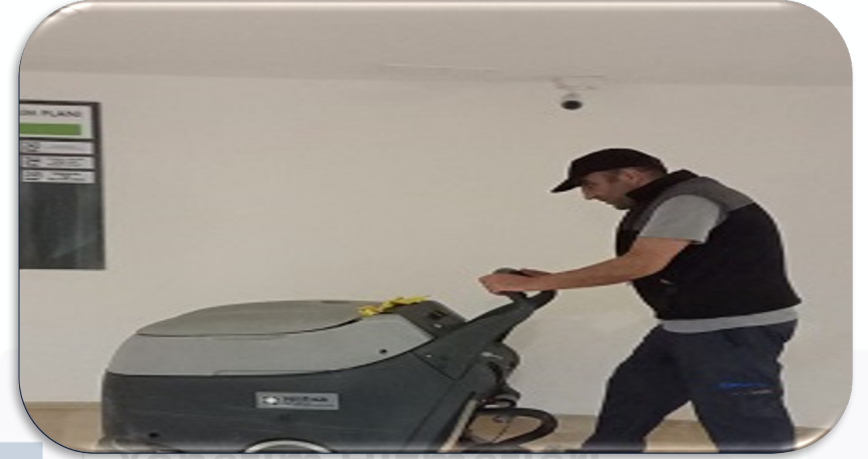
Bina geneli ortak alan koridor zemin temizliđi gerekleřtirilmiřtir.