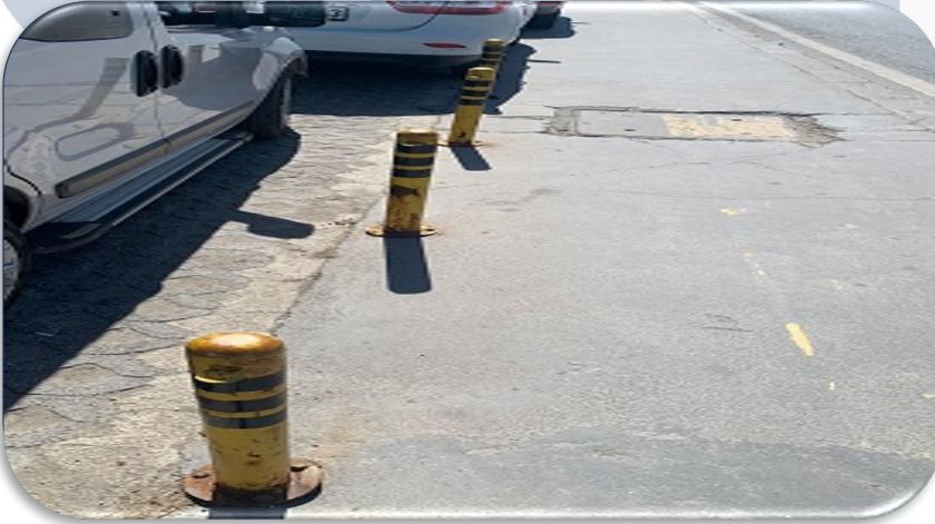
Açık otopark alanındaki demir delinatörlerin hasar kontrolleri gerçekleştirilmiştir.