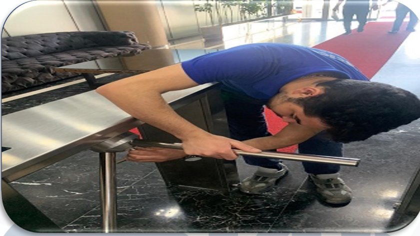
Turnike sistemi periyodik kontrolleri gerçekleştirilmiştir.