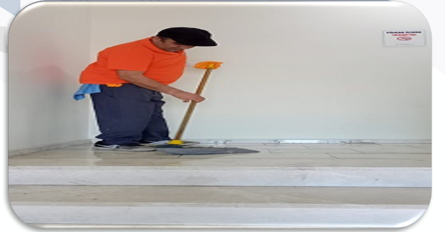
Yangın merdivenlerinin temizliği gerçekleştirilmiştir.