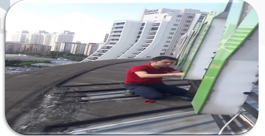
Çatıdaki Vetro City ışıklı tabelasındaki I harfi kablo arızası giderilmiştir.