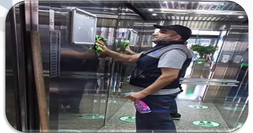
Asansörlerin kabin ii temizliđi gerekleřtirilmiřtir.