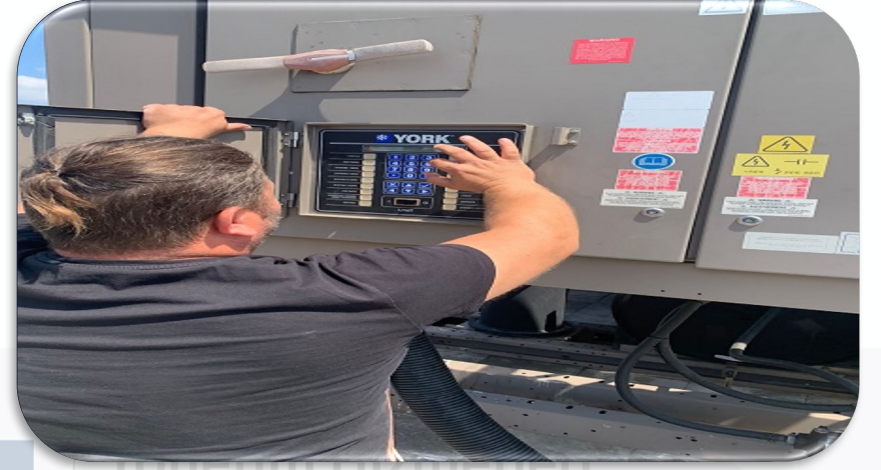
Soğutma Sistemi açılış bakım faaliyeti gerçekleştirilmiştir.