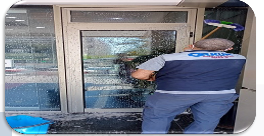
Bina giriş kapıları yıkanmıştır.