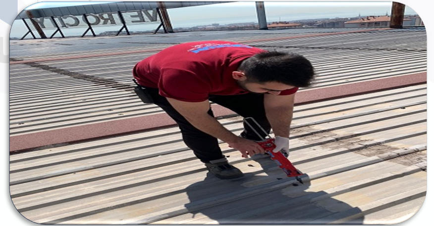
Çatı teras alanındaki vida boşlukları silikon ile kapatılmıştır.