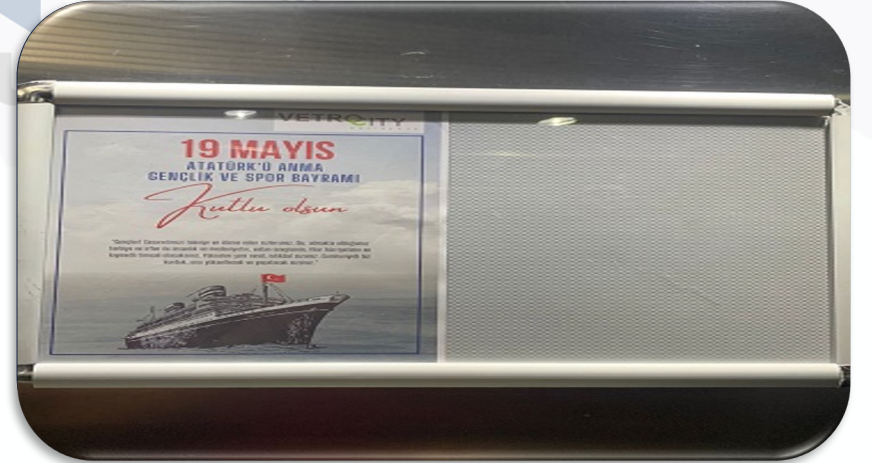
Dönemsel daire sakini bilgilendirme duyuruları hazırlanmış ve duyuru panolarına asılmıştır.