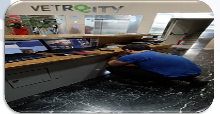
A Lobi kablo hatları önüne koruma amaçlı kapak yapılmıştır.