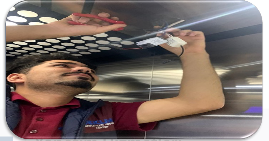
Bina geneli aydınlatma hasar kontrolleri gerçekleştirilmiştir.