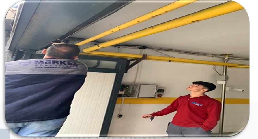
Otopark çıkış kapısının periyodik kontrolleri sağlanmıştır.