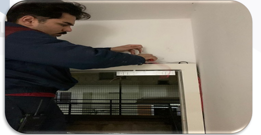
A blok yük asansörünün lobi katındaki çıkış kapısına şifreli geçiş kapı kilidi montajı yapılmıştır.