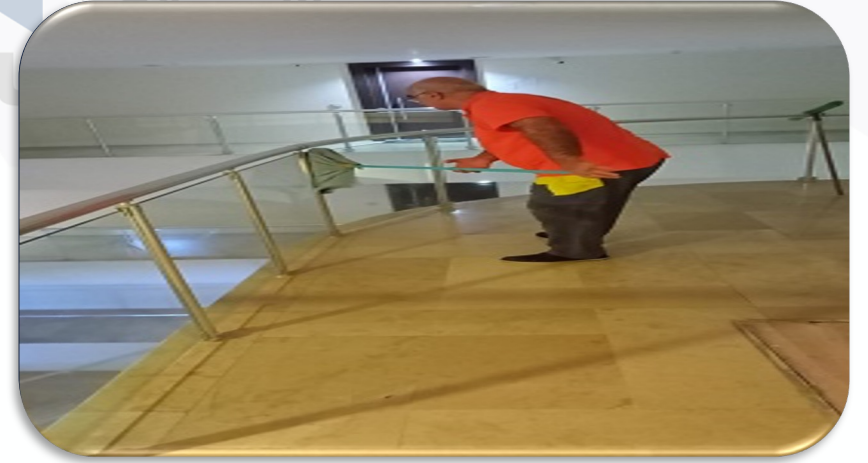
Ortak alan cam temizliği gerçekleştirilmiştir.