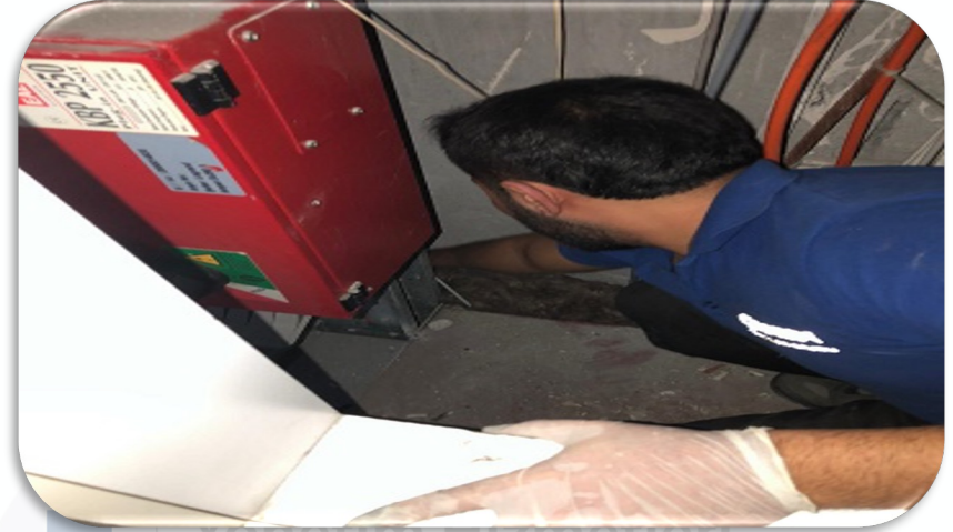
Yangın yönetmeliği kapsamında bina geneli şaft boşluklarının iç kısmına taş yünü uygulaması yapılmıştır.