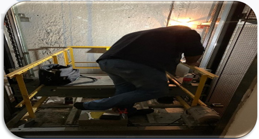
Asansörlerin aylık bakım faaliyeti gerçekleştirilmiştir.