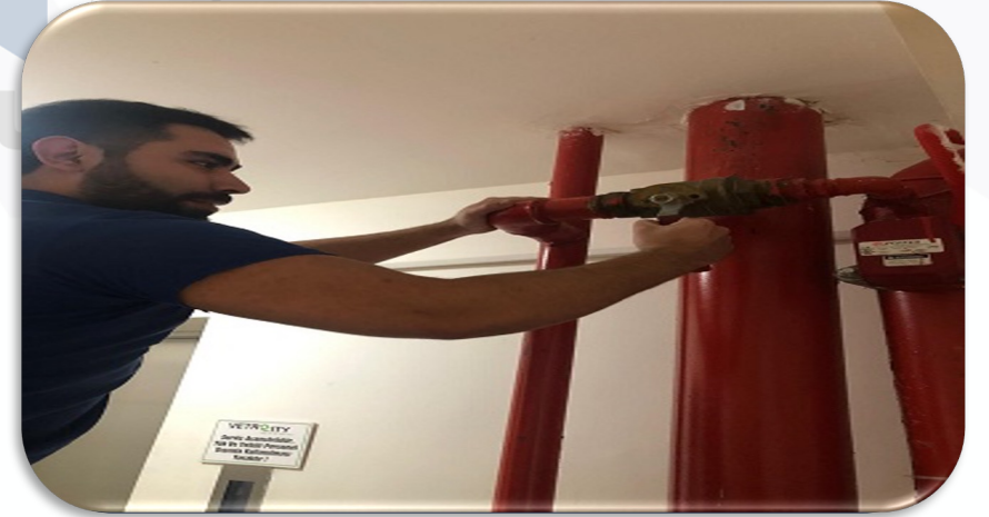
Yangın Mekanik Sistemi periyodik kontrolleri sağlanmıştır.