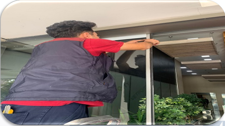
Bina giriş kapılarının periyodik kontrolleri sağlanmıştır.