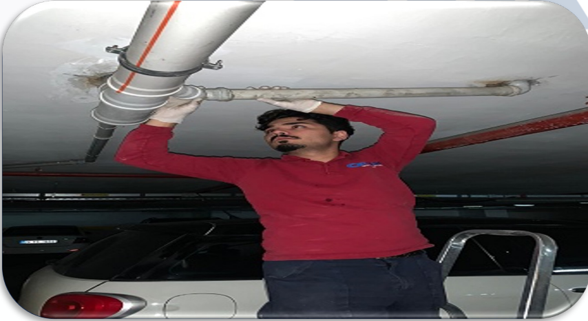
Kapalı otopark katlarındaki yağmur suyu toplama borularının hasar kontrolleri gerçekleştirilmiştir.