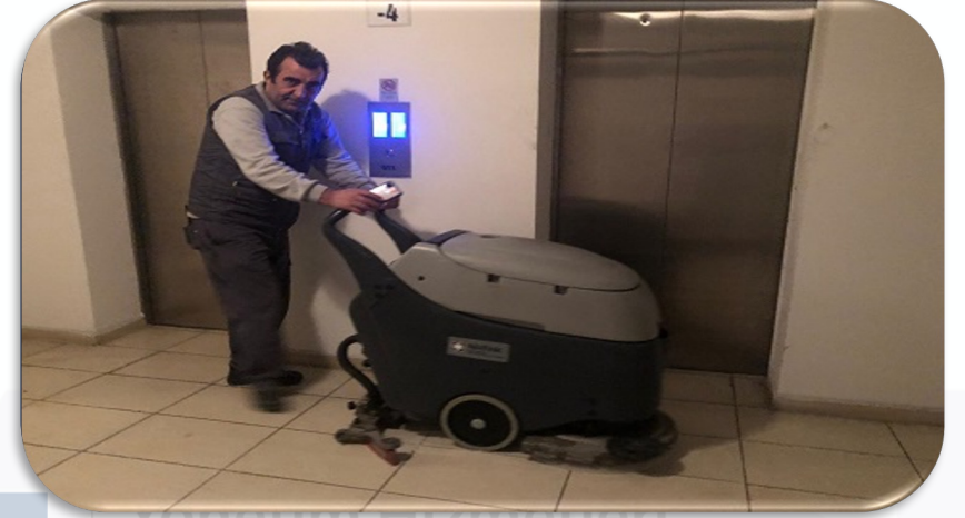
Ortak alan koridor zemin temizliği gerçekleştirilmiştir.