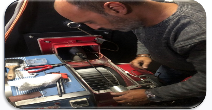
Isıtma sistemi periyodik bakım faaliyeti gerçekleştirilmiştir.