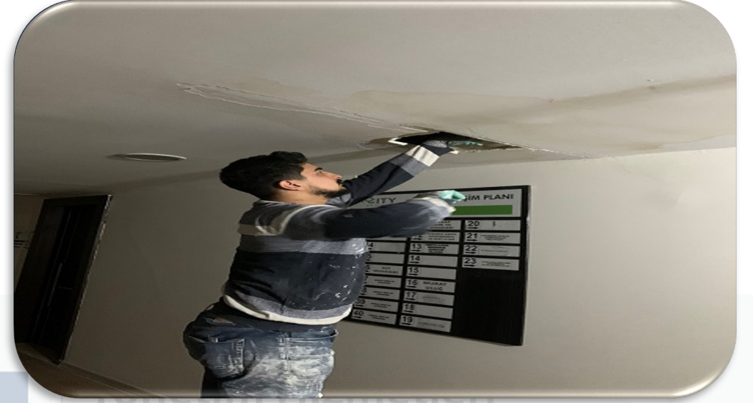
Ortak alan koridor duvarlarının boya ihtiyacına ilişkin kontroller gerçekleştirilmiştir.