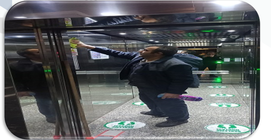
Asansörlerin kabin içi temizliği gerçekleştirilmiştir.