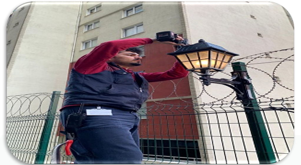
Otopark giriş yolu üzerindeki aydınlatmaların hasar kontrolleri sağlanmıştır.