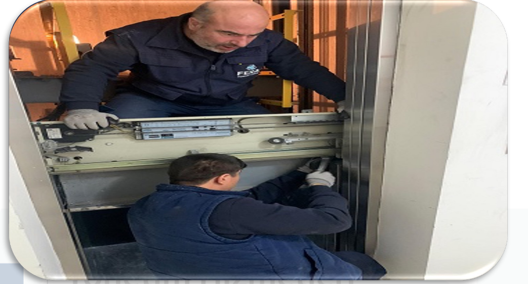
A Blok yük asansörünün makastan çıkan kapısı yerine getirilmiştir.