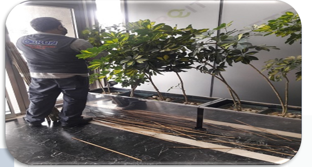
Lobi iç mekan bitkilerinin periyodik bakım faaliyeti gerçekleştirilmiştir.