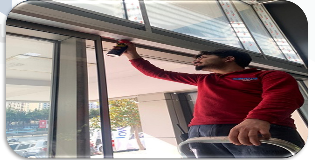
Lobi giriş kapılarının periyodik bakımları gerçekleştirilmiştir.