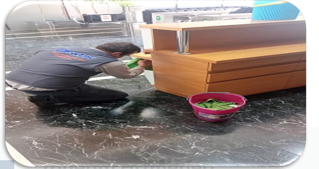
Lobilerin banko temizliği gerçekleştirilmiştir.