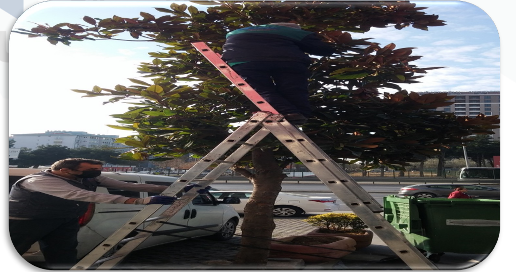
Binamız ön cephesindeki ağaçlar budanmıştır.