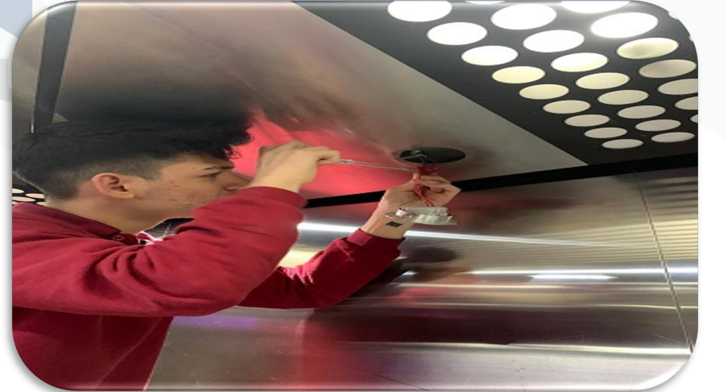
Asansör kabin içi aydınlatmalarının hasar kontrolleri gerçekleştirilmiştir.