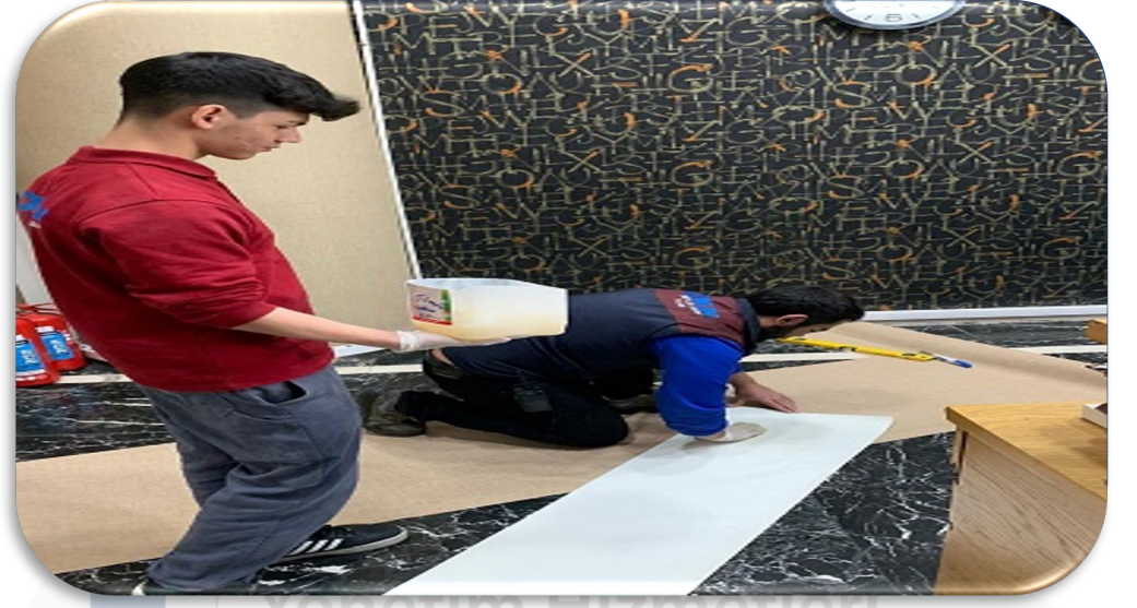
Lobilerin duvar kağıdı hasar kontrolleri sağlanmış ve ihtiyaç duyulan alanların kağıtları yenilenmiştir.