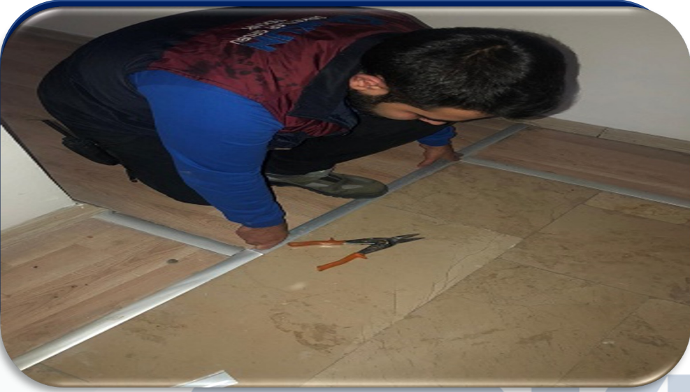
Bina geneli süpürgeliklerin hasar kontrolleri sağlanmıştır.