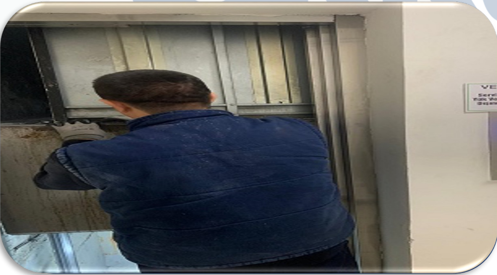
A blok yük asansörünün paten değişimleri gerçekleştirilmiştir.