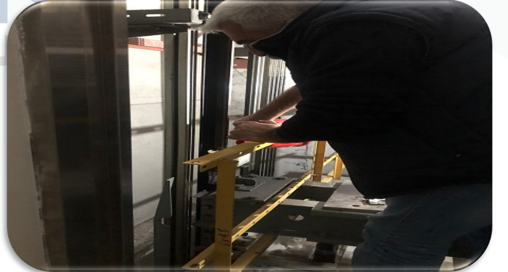
Asansörlerin aylık bakım faaliyeti gerçekleştirilmiştir.