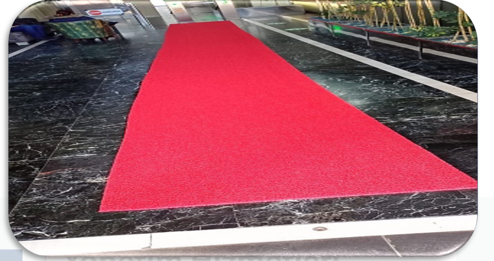
A Blok lobi zemininde kullanılan eski kıvrıkcık paspas yenisi ile değiştirilmiştir.