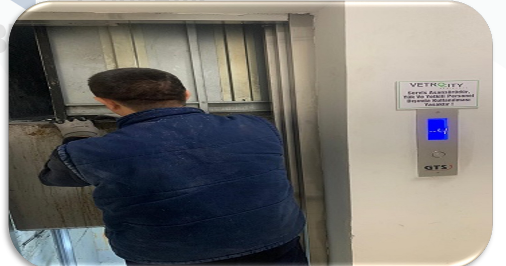
Asansörlerin aylık bakım faaliyeti gerçekleştirilmiştir.