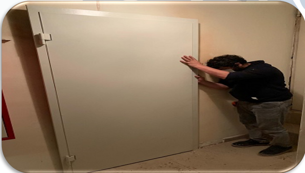
Yangın yönetmeliği kapsamında kazan dairesine ilave kapı montajı gerçekleştirilmiştir.