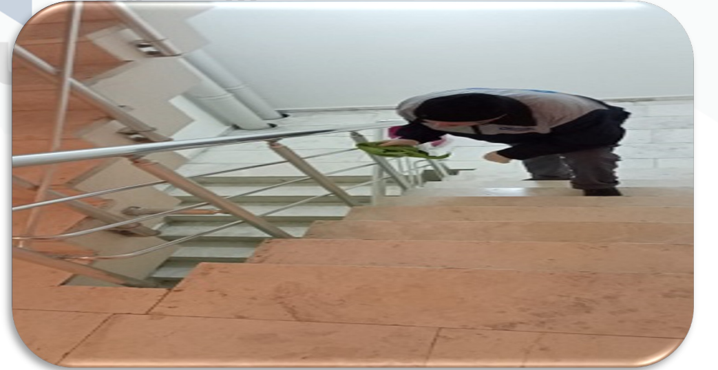
Bina geneli merdiven küpeşterinin temizliği gerçekleştirilmiştir.