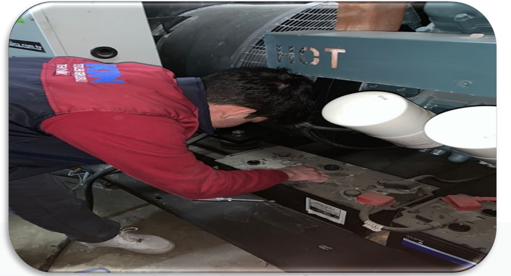
Jeneratörlerin periyodik kontrolleri gerçekleştirilmiştir.