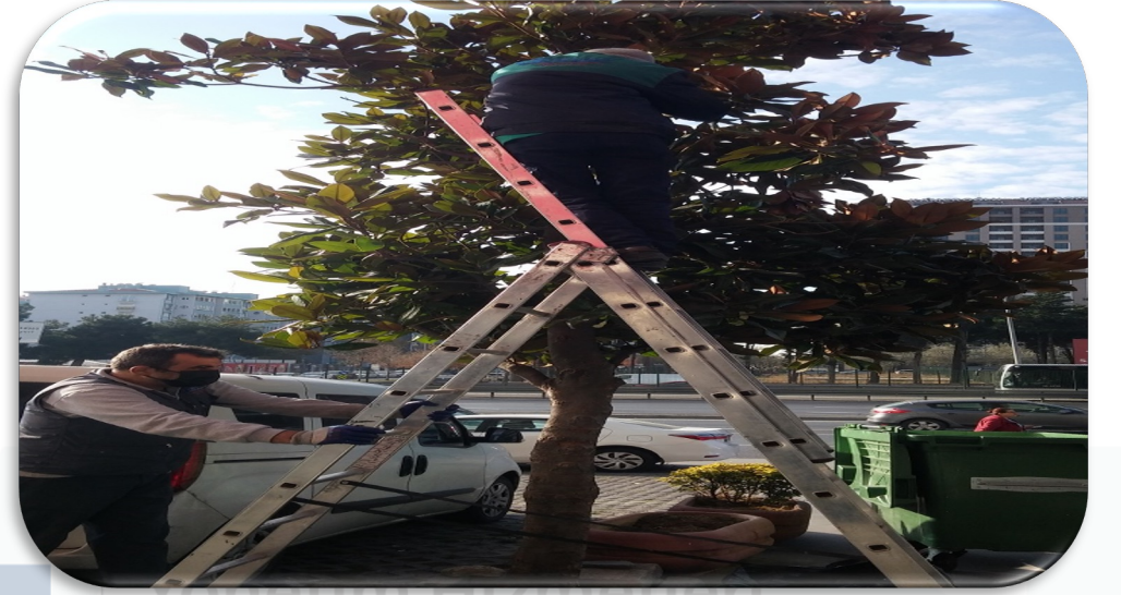
Binamız ön cephesindeki ağaçlar budanmıştır.