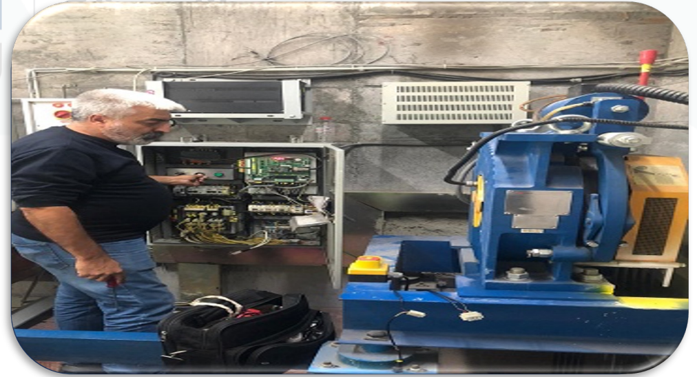
Asansörlerin aylık bakım faaliyeti gerçekleştirilmiştir.