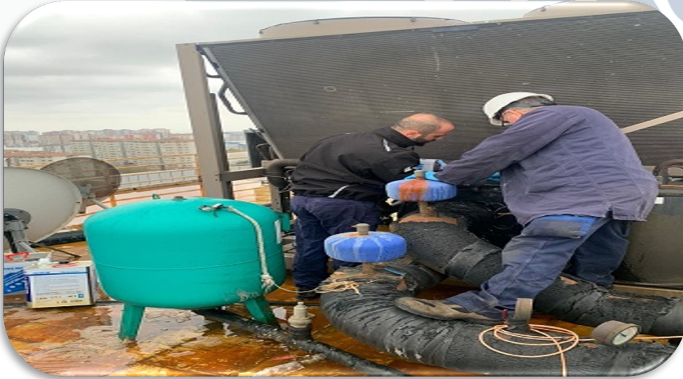
Chiller soğutma sistemi periyodik kapanış bakımı gerçekleştirilmiştir.