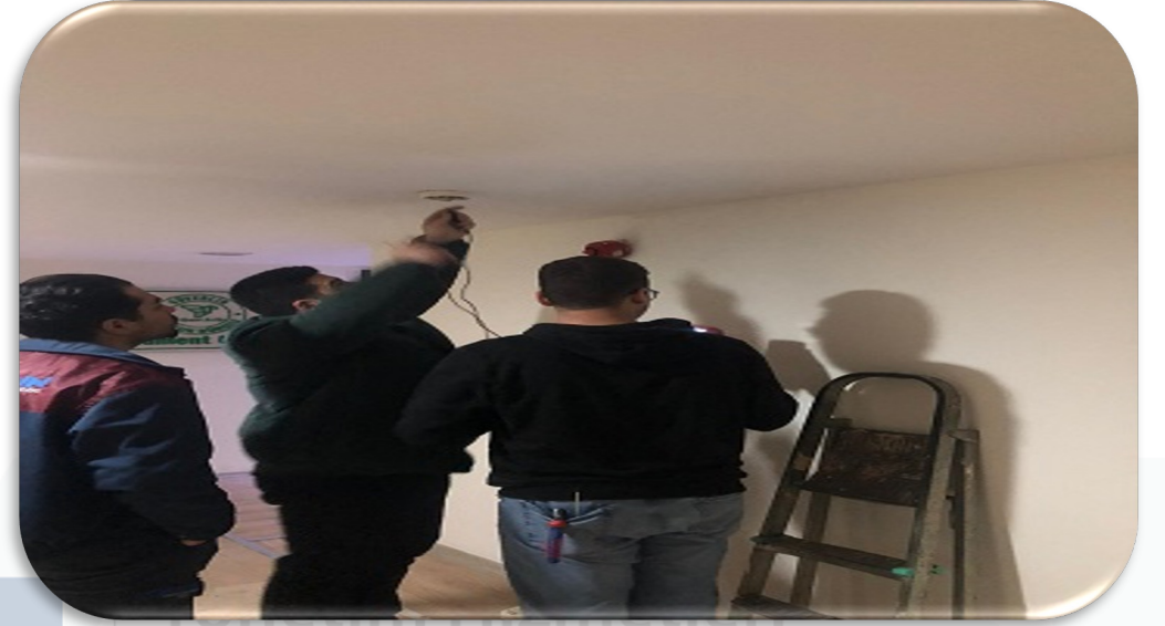
Yangın algılama periyodik sistem kontrolleri gerçekleştirilmiştir.