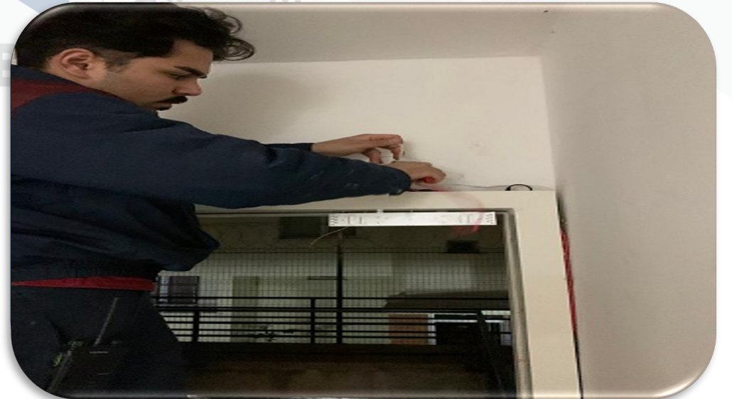
A blok yük asansörünün lobi katındaki çıkış kapısına şifreli geçiş kapı kilidi montajı yapılmıştır.