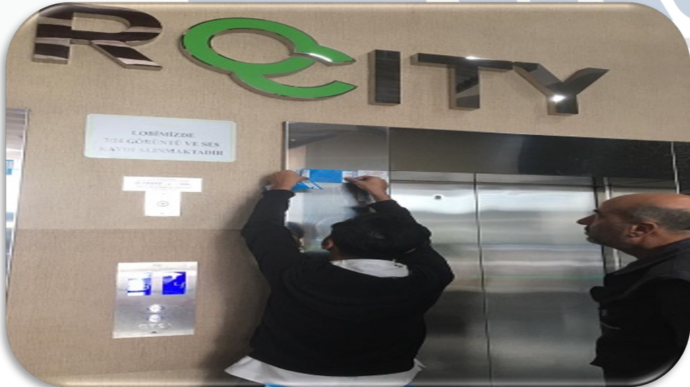
Asansörlerin yasal denetim faaliyeti gerçekleştirilmiş ve tamamı için mavi etiket uygun görülmüştür.