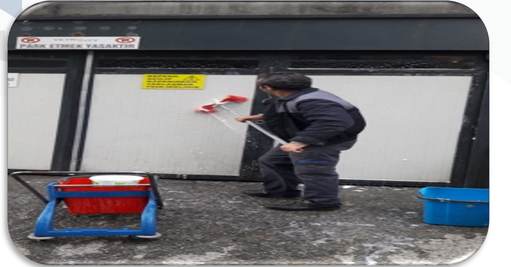
Kapalı otopark çıkış kepengi periyodik temizliği gerçekleştirilmiştir.