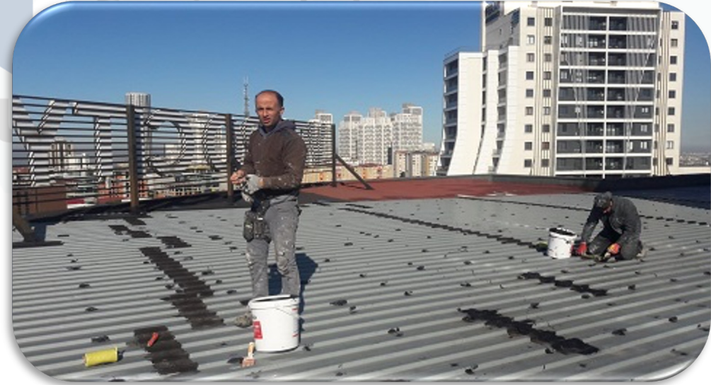
Çatıda lokal izolasyon çalışmaları gerçekleştirilmiştir.