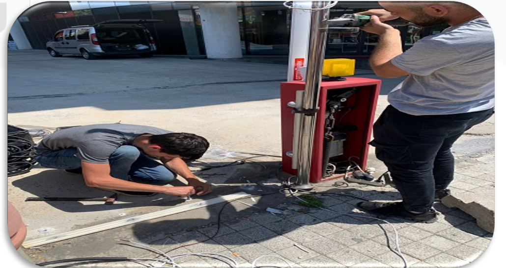
Plaka Tanıma Sistemi kurulmuştur.