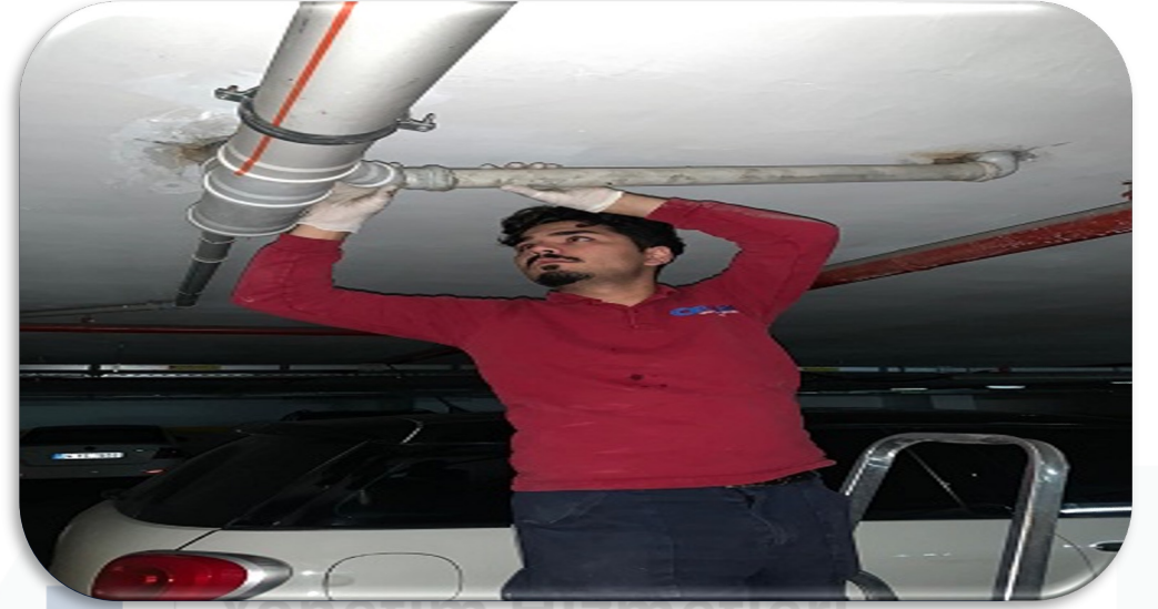
Kapalı otopark katlarındaki hasarlı yağmur suyu toplama pimaş hattı yenilenmiştir.