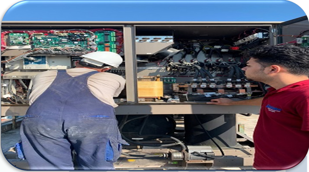
A Blok Chiller Soğutma Sisteminin arızalı parçaları, maliyeti daha ekonomik olan 2.el(çıkma) parçalar ile değiştirilmiştir ve sistem devreye alınmıştır.