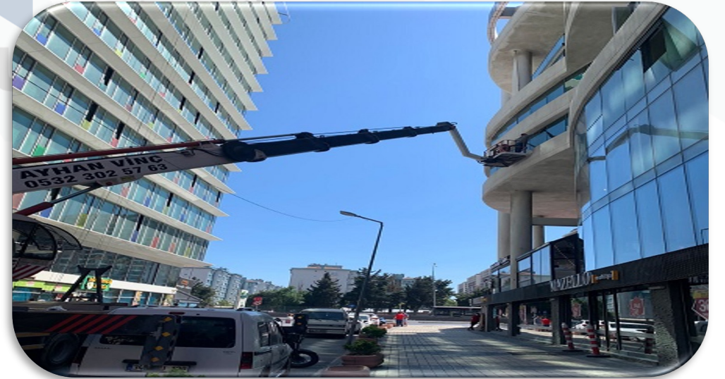
Dış cephe cam temizliği faaliyeti gerçekleştirilmiştir.