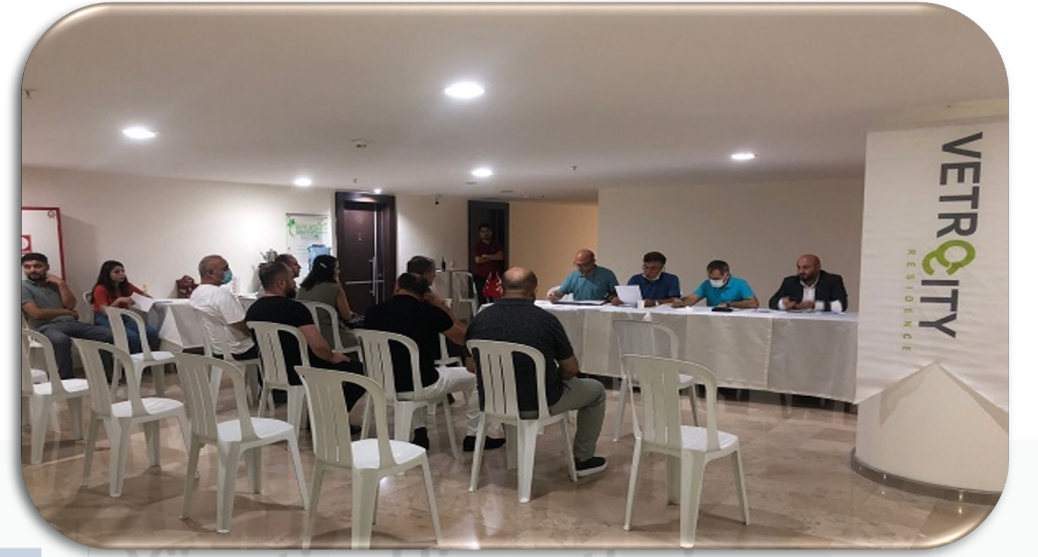
5/12 Ağustos 2022 tarihlerinde Olağanüstü Genel Kurul Toplantısı gerçekleştirilmiştir.