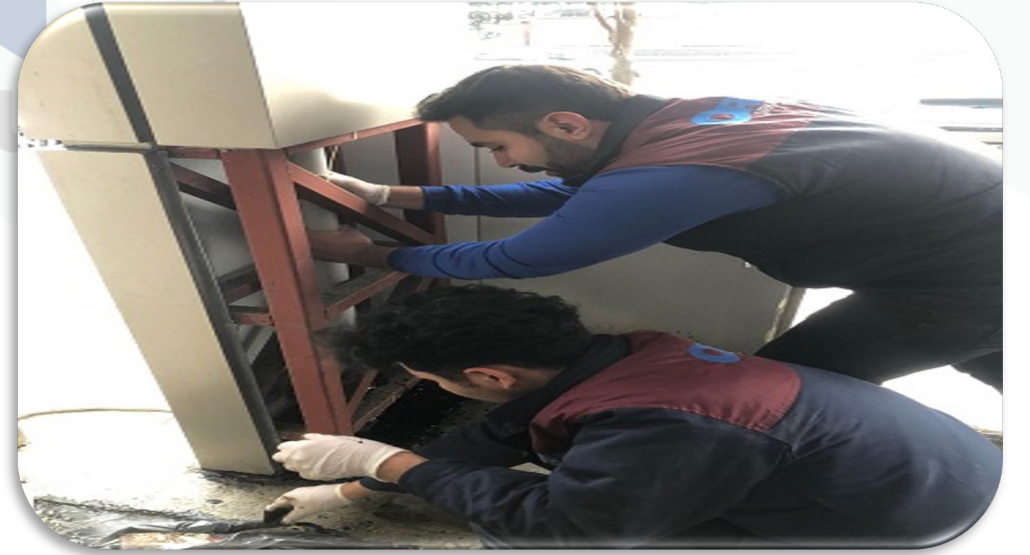
B Blok giriş alanındaki izolasyon eksikleri giderilmiştir .