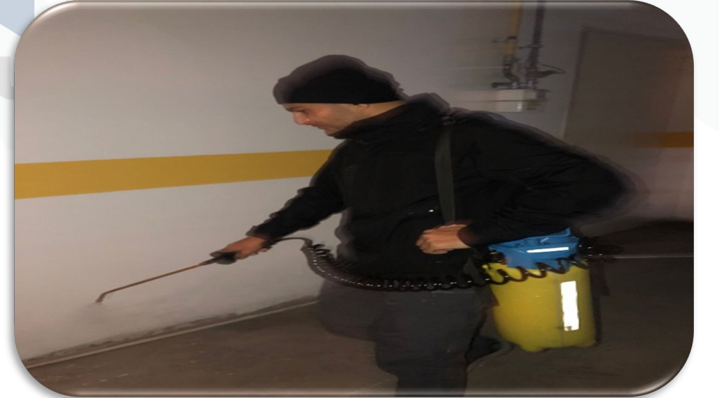
Periyodik ortak alan ilaçlama faaliyeti gerçekleştirilmektedir.