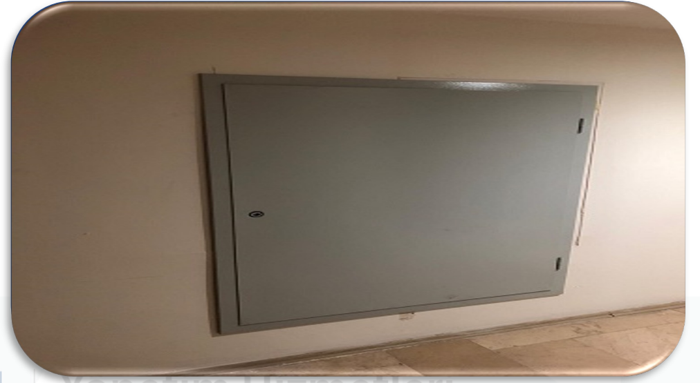
Ortak alandaki shaft kapakları yangın yönetmeliği kapsamında değiştirilmiştir.