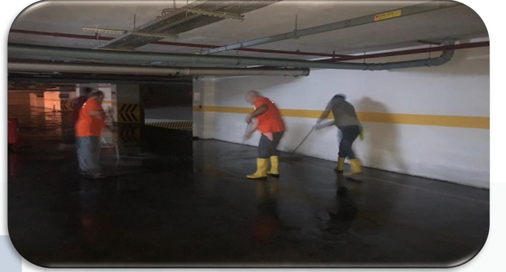
Gayrimenkul Kapalı otopark katları yıkanmıştır.