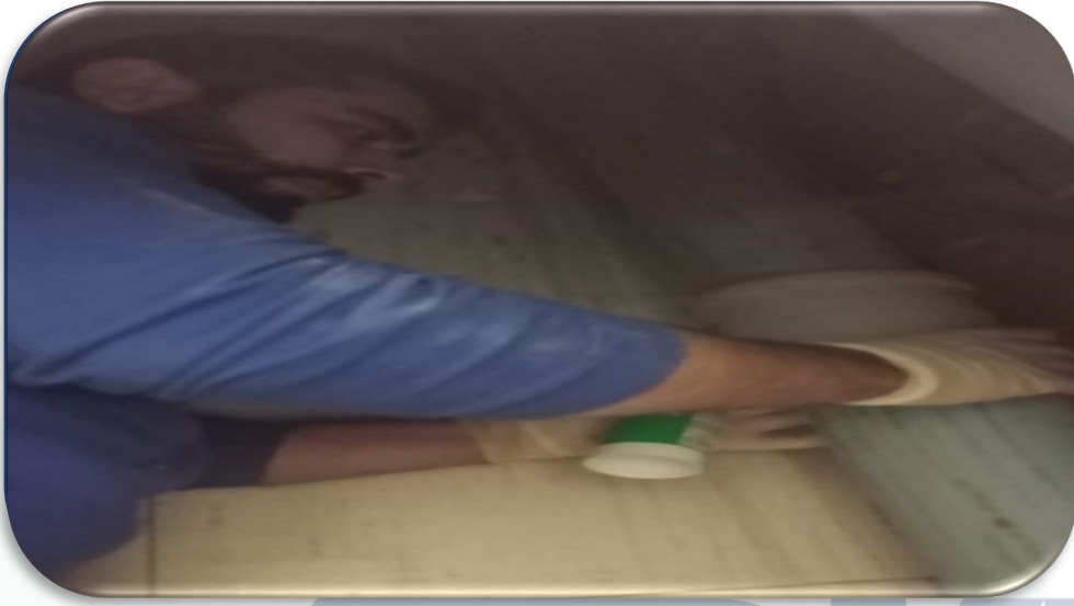
3.Kat ortak alan pimaş çatlağına teknik müdahalede bulunulmuştur.