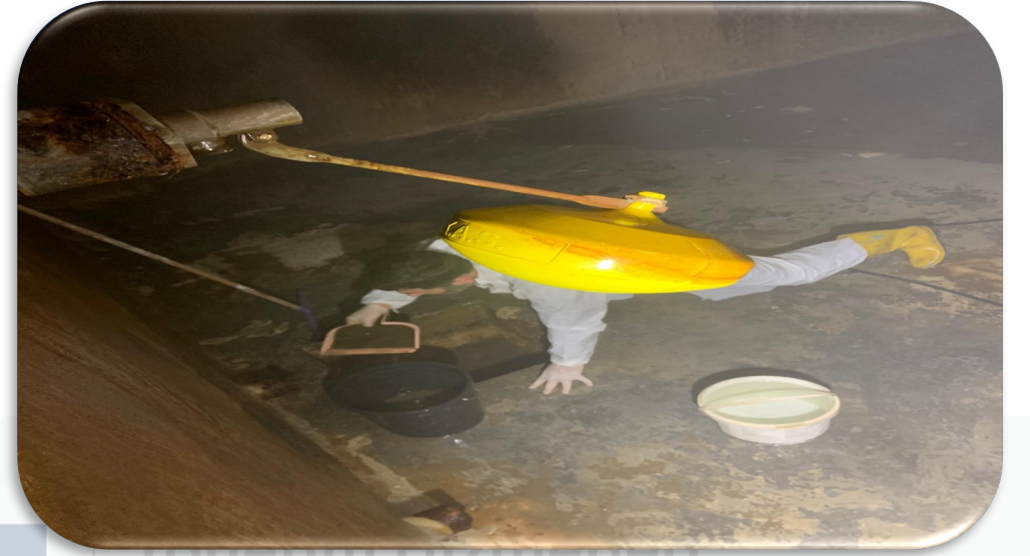
Kullanım suyu deposunun periyodik temizliği gerçekleştirilmiştir.