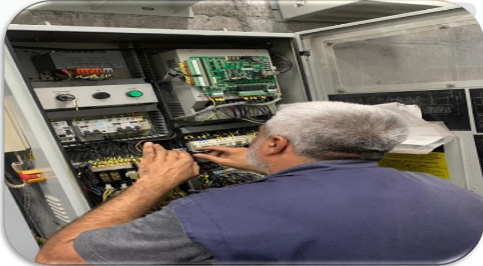
A Blok sağ asansör inverter tamiri gerçekleştirilmiştir.