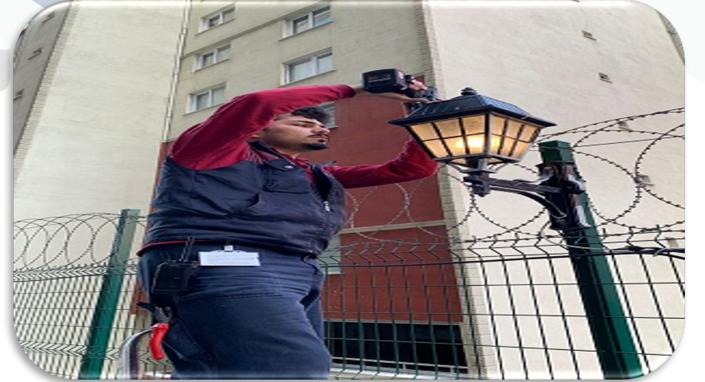
Otopark giriş yolu üzerindeki aydınlatmaların hasar kontrolleri sağlanmıştır.