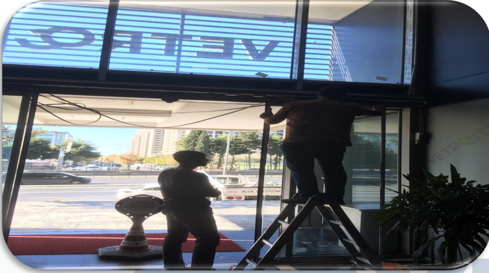
B Blok giriş kapısı arızalı motor mekanizması yenisi ile değiştirilmiştir.