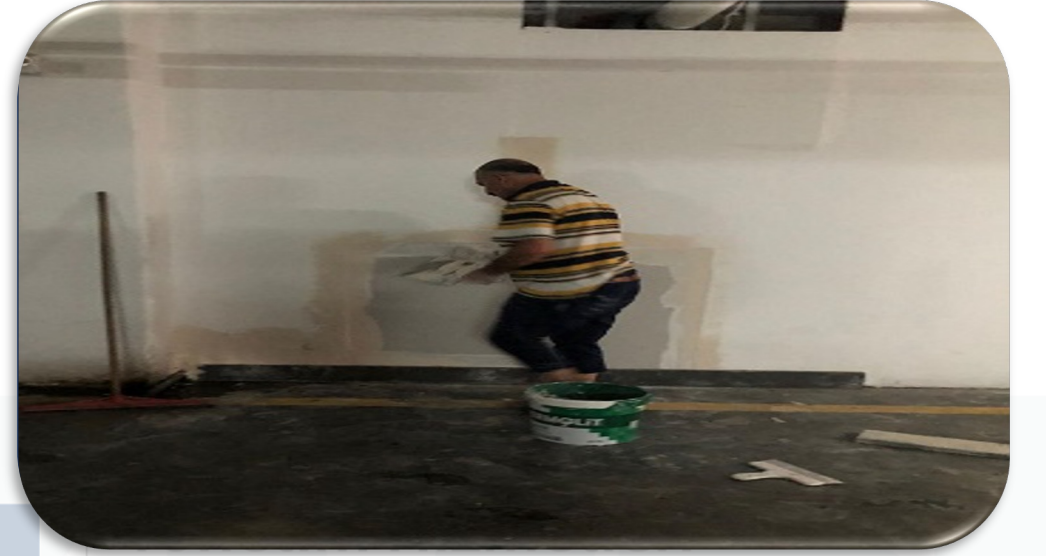
Kapalı otopark hasarlı duvarları tadilat işlemleri gerçekleştirilmiştir.