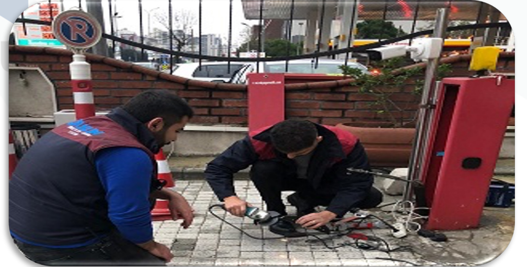
Otopark giriş bariyer motorunun kırılan mili değiştirilmiş, montajı gerçekleştirilmiş ve bariyer aktif hale getirilmiştir.