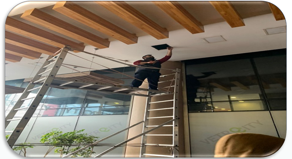
Lobilerin arızalı tavan aydınlatmaları yenileri ile değiştirilmiştir.