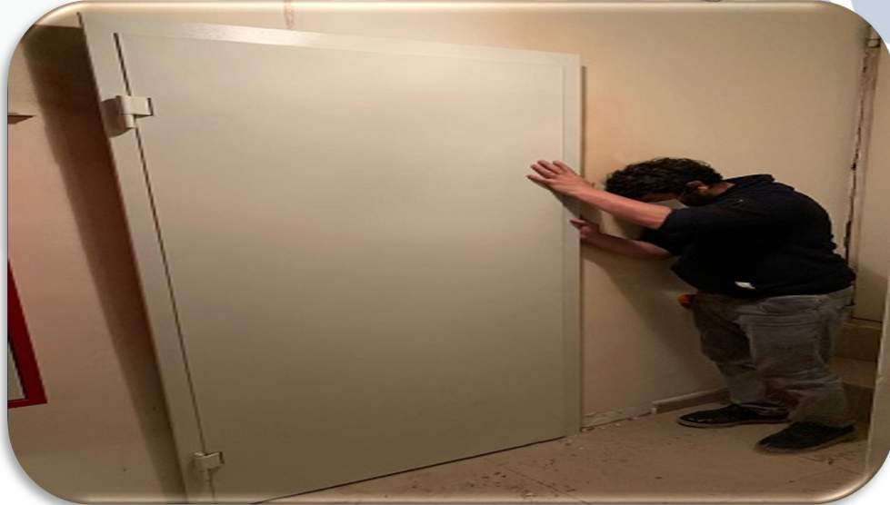
Yangın yönetmeliği kapsamında kazan dairesine ilave kapı montajı gerçekleştirilmiştir.