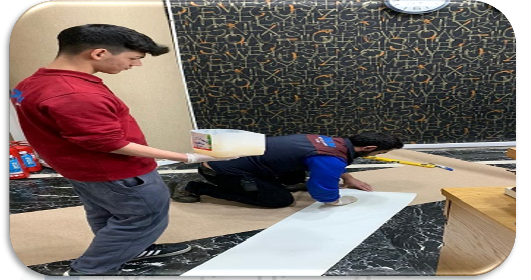
Lobi asansör önlerindeki yırtık duvar kağıtları yenilenmiştir.