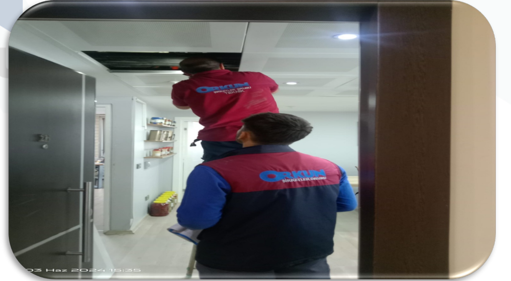
Baėımsız bölümlerin teknik servis talepleri karŒılanmıŒtır.