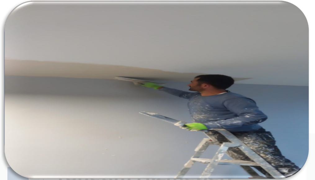
Ortak alan alıřmalarında hasar alan bb'lerde tadilat alıřmaları yurütulmüřtür.