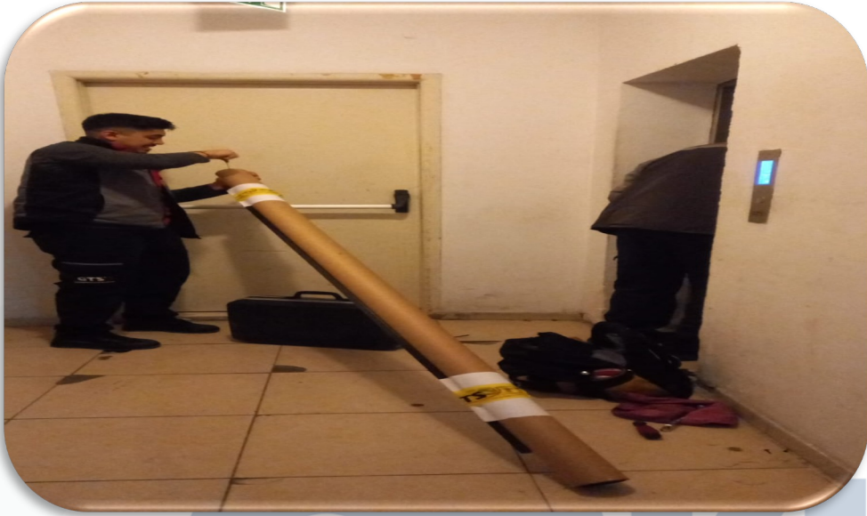
A Blok yük asansörü fotosel takımı deęiřmiřtir.