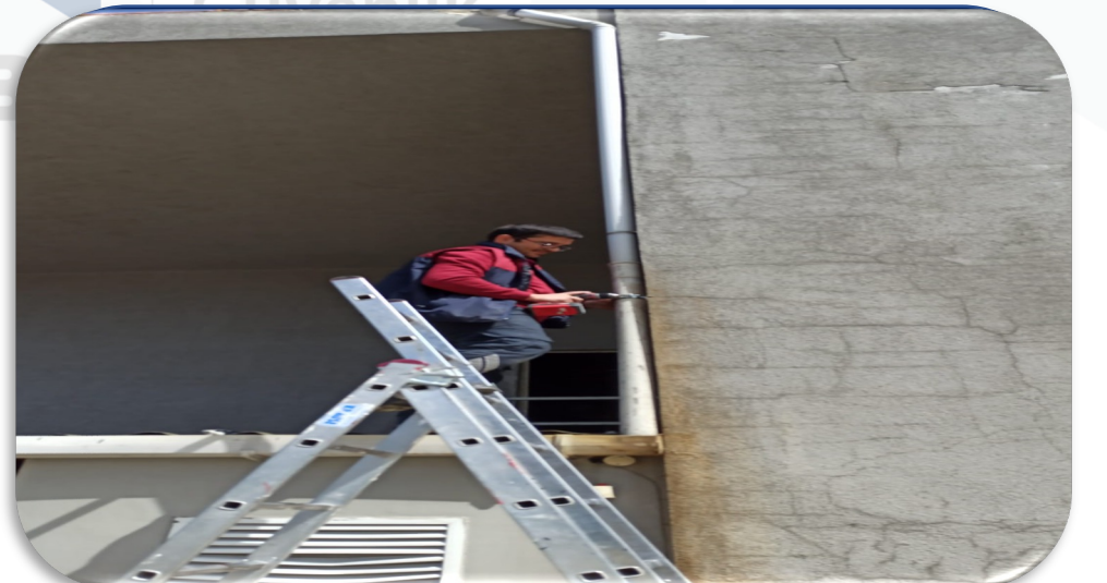
atı yaęmur suyu tahliye pimař hattı kontrolleri gerekleřtirilmiřtir.