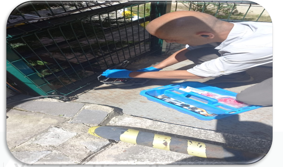
Yönetim Hizmetleri Gayrimenkul Periyodik ortak alan ilaçlama faaliyeti gerçekleştirilmektedir.