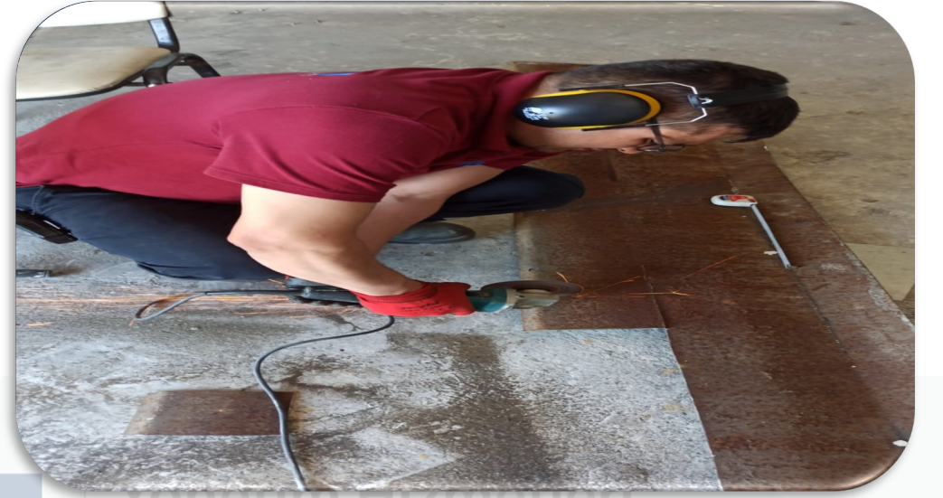
atı katındaki ‘‘Vetro City ‘‘ ıŒıklı tabelasında yaėıŒa karŒı koruma önlemleri alınmıŒtır.