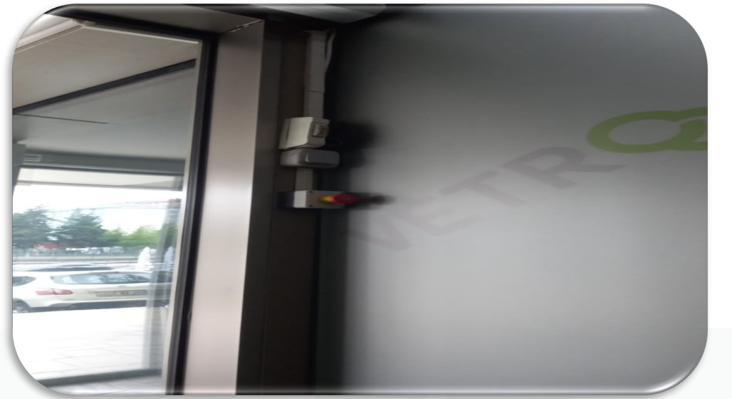
B Blok giriş kapısına anahtarlı acil stop butonu takılmıştır.