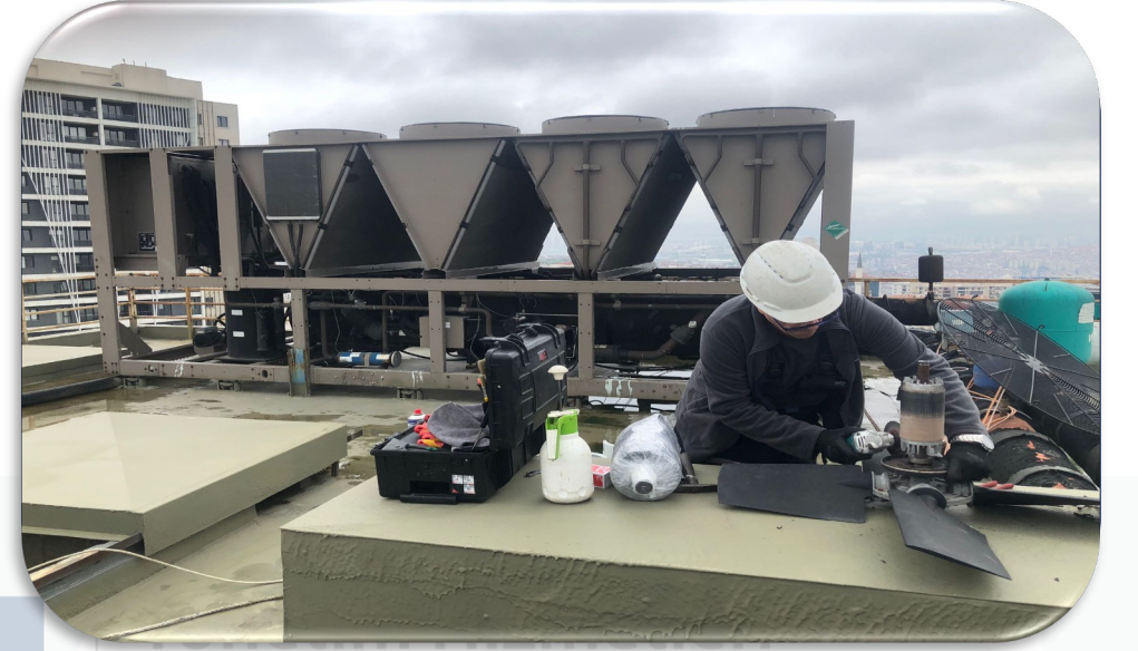
Chiller Soğutma Sistemi açılış bakımı gerçekleştirilmiştir.