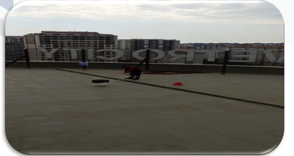
atı zemin temizlięi gerekleřtirilmiřtir.