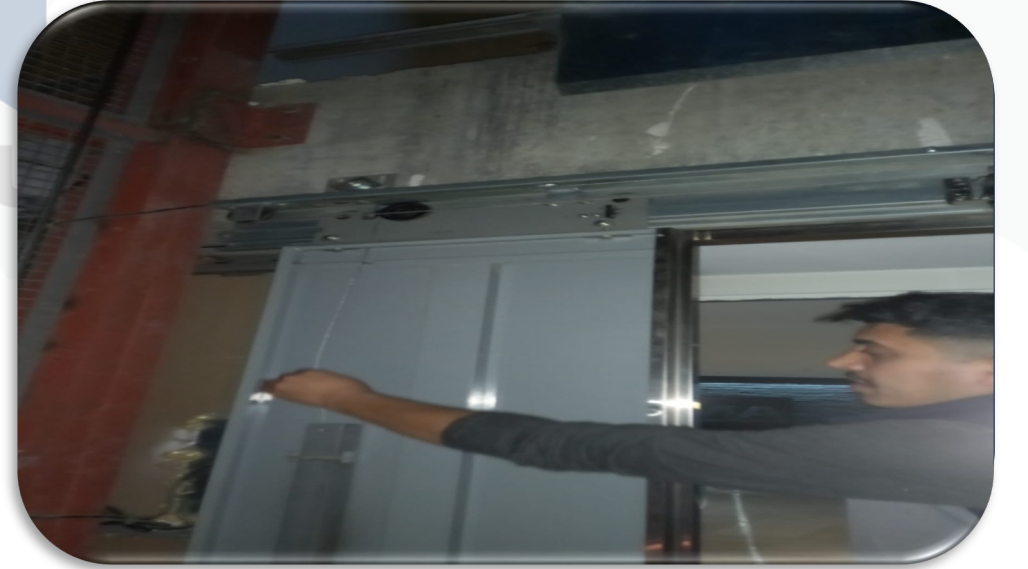
A Blok yük asansörü kapı arızası giderilmiştir.