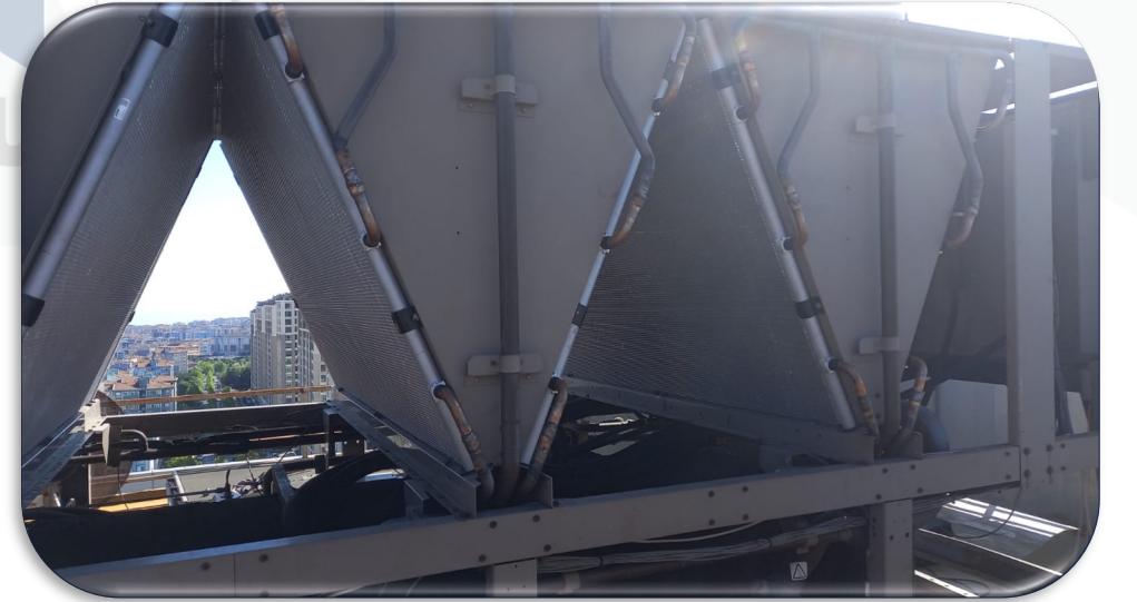
Chiller Soğutma Sistemi B Blok tarafındaki 8 adet arızalı kondanser yenileri ile değiştirilmiştir.