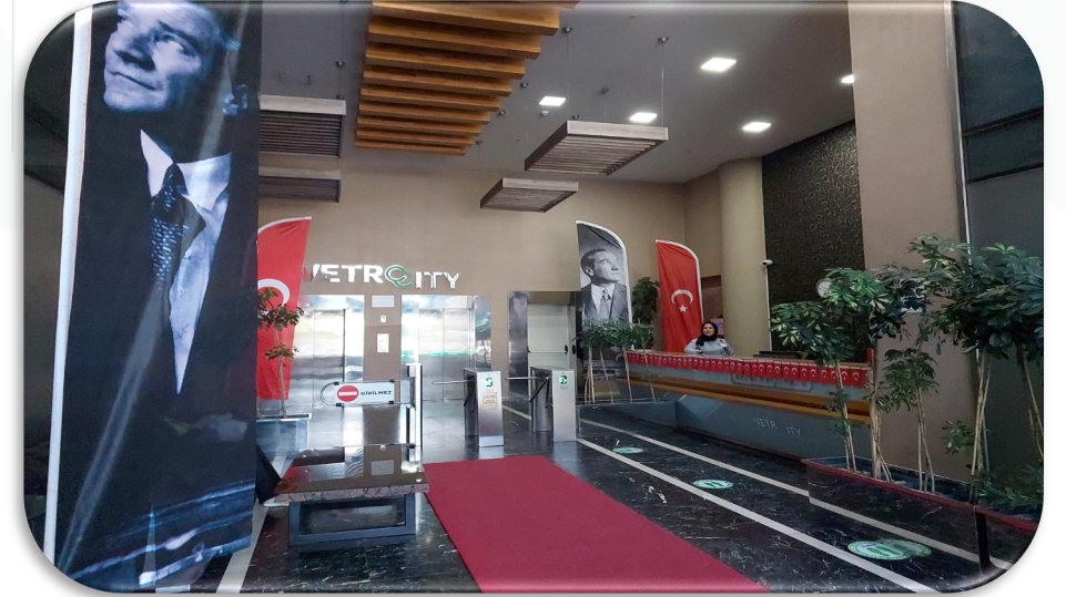
19 Mayıs Atatürk'ü Anma, Gençlik ve Spor Bayramı dolayısıyla lobiler süslenmiştir.