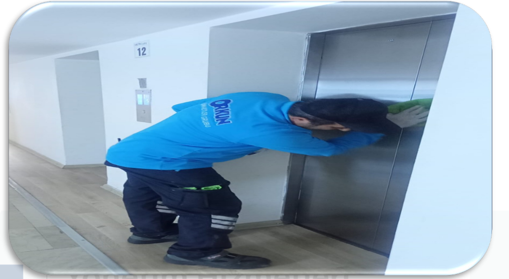
Asansr kapılarının parlaticı ile detaylı temizlięi gerekleřtirilmiřtir.