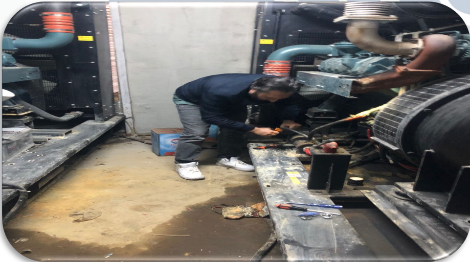
Jeneratörlerin periyodik bakım faaliyeti gerekleřtirilmiřtir.