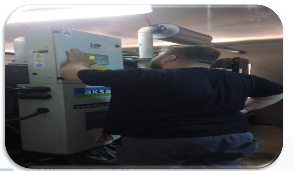
Jeneratörlerin periyodik kontrolleri sağlanmıştır.