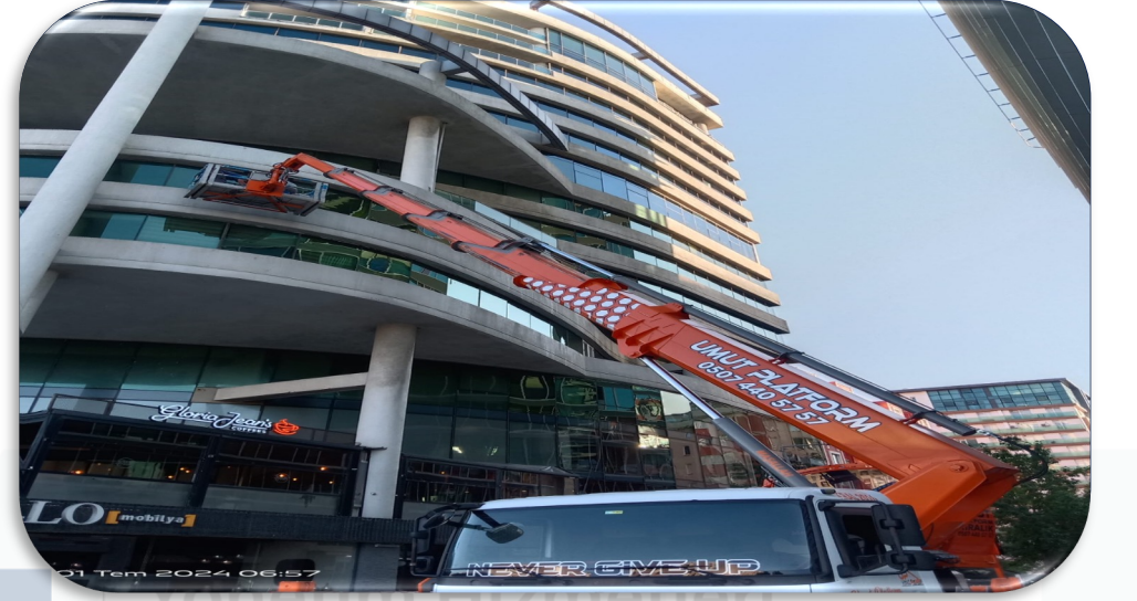
Dıř cephede cam temizlik faaliyeti gerekleřtirilmiřtir.