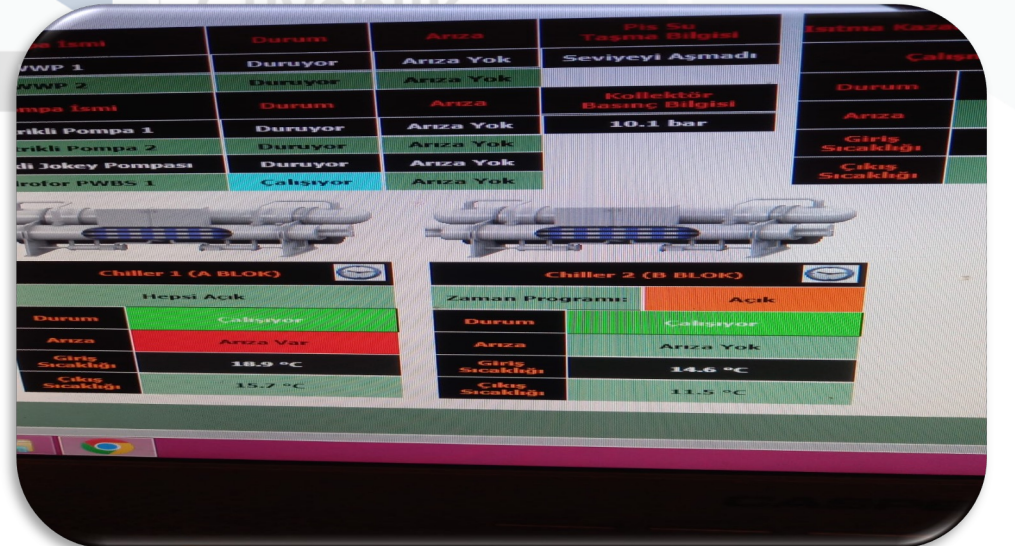
Otomasyon sistemi periyodik kontrolleri gerçekleştirilmiştir.