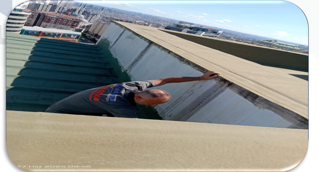
Çatı zemin izolasyon kontrolleri gerçekleştirilmiştir.