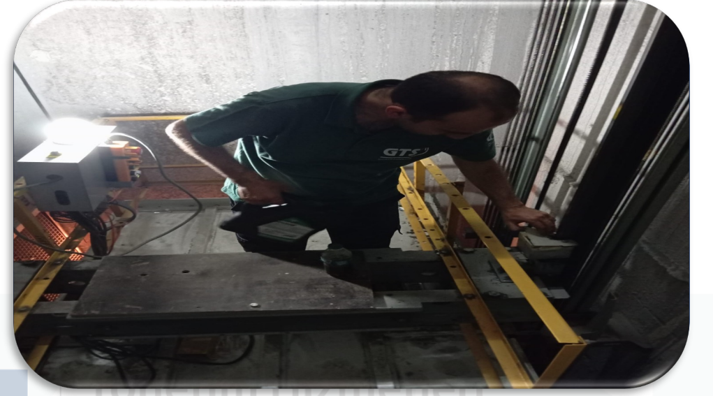
Asansörlerin aylık bakım faaliyeti gerçekleştirilmiştir.