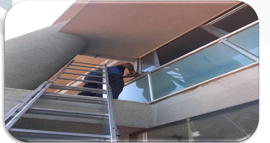
Dıř cephede cam temizlięi sonrası bb lerde temizlik kontrolleri saęlanmıřtır.