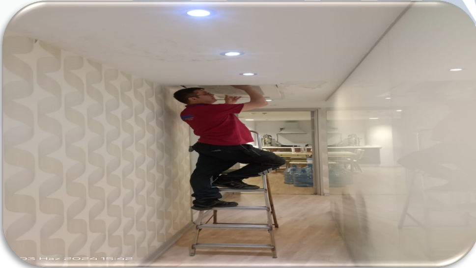
Bb lerin fancoil soğuk hava akış kontrolleri sağlanmıştır.