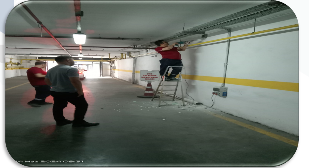
-1 Kapalı otopark su toplama pimaş hattı kaçağı giderilmiştir.