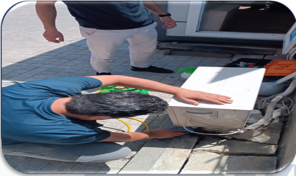
Güvenlik kabini ve teknik ofisteki klimaların periyodik bakımları gerçekleştirilmiştir.