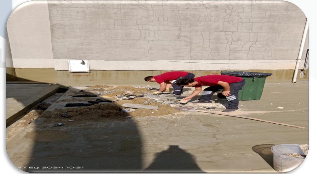
Isıtma sistemi 12.kat su dönüş hattındaki su kaçağının tespiti için çalışmalara başlanılmıştır.