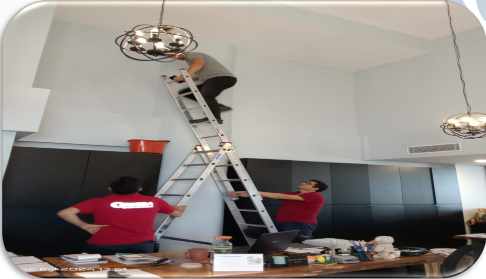
Bb'lerin teknik servis talepleri karşılanmıştır.