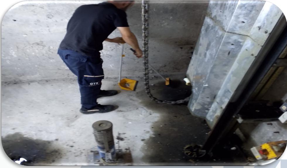
Asansörlerin aylık bakım faaliyeti gerçekleştirilmiştir.