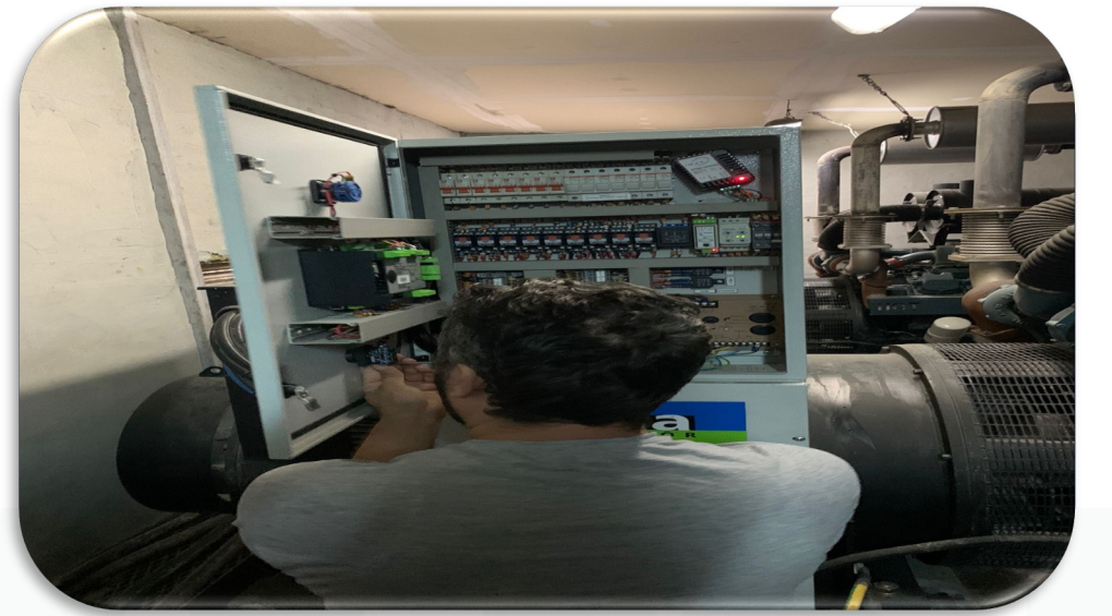
Jeneratörlerin periyodik bakım faaliyeti gerçekleştirilmiştir.