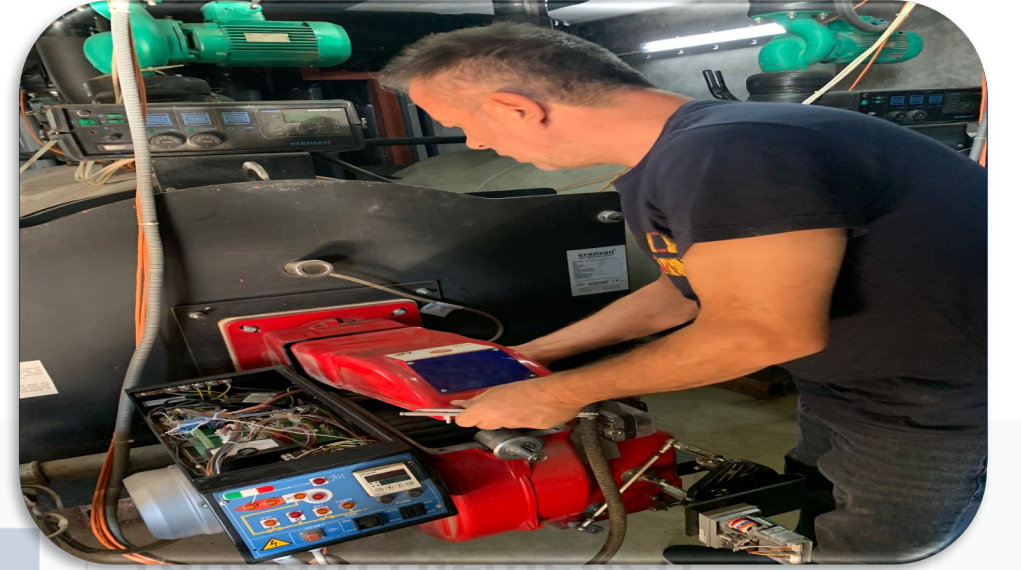
Isıtma sistemi periyodik bakım faaliyeti gerçekleştirilmiştir.