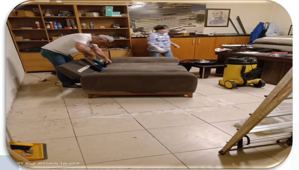
Lobi kanepelerinin temizlięi gerekleřtirilmiřtir.