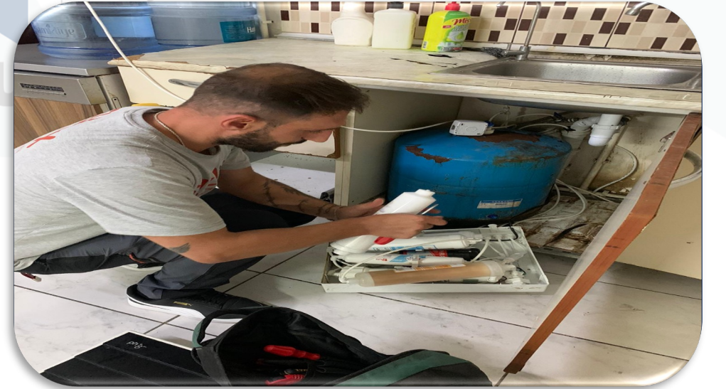
Su arıtma cihazı periyodik filtre değişimi gerçekleştirilmiştir.