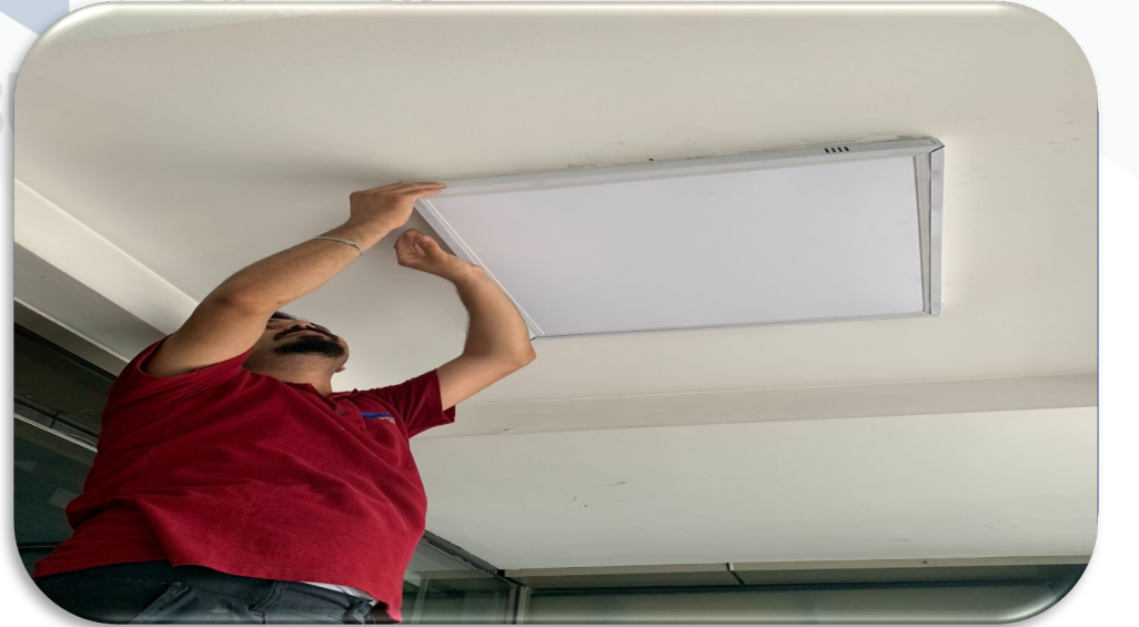
Bina geneli aydınlatma hasar kontrolleri sağlanmıştır.