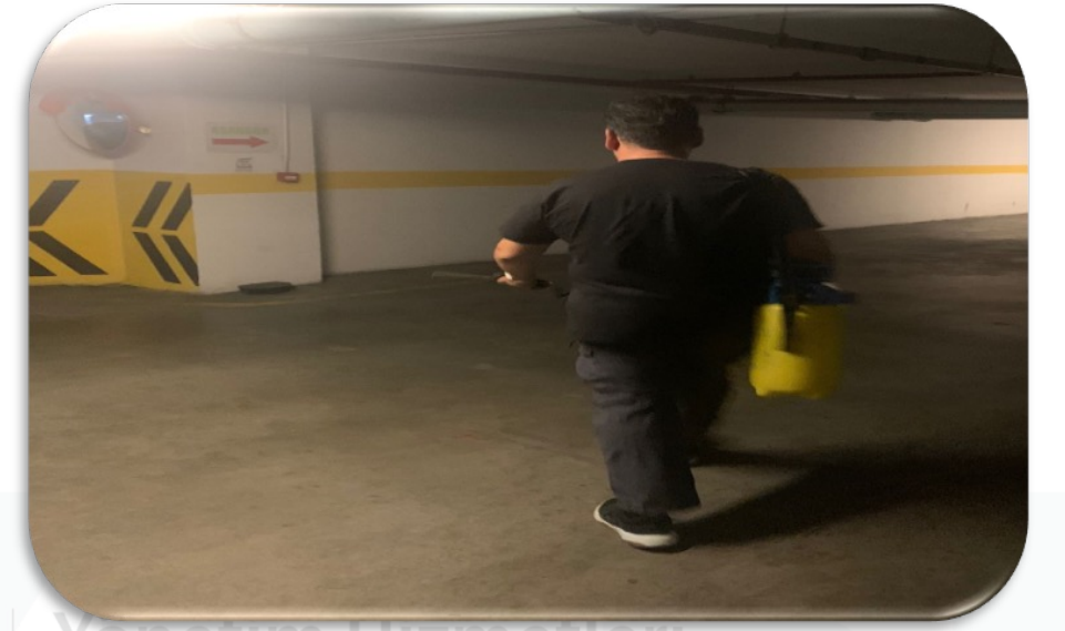
Periyodik ortak alan ilaçlama faaliyeti gerçekleştirilmektedir.