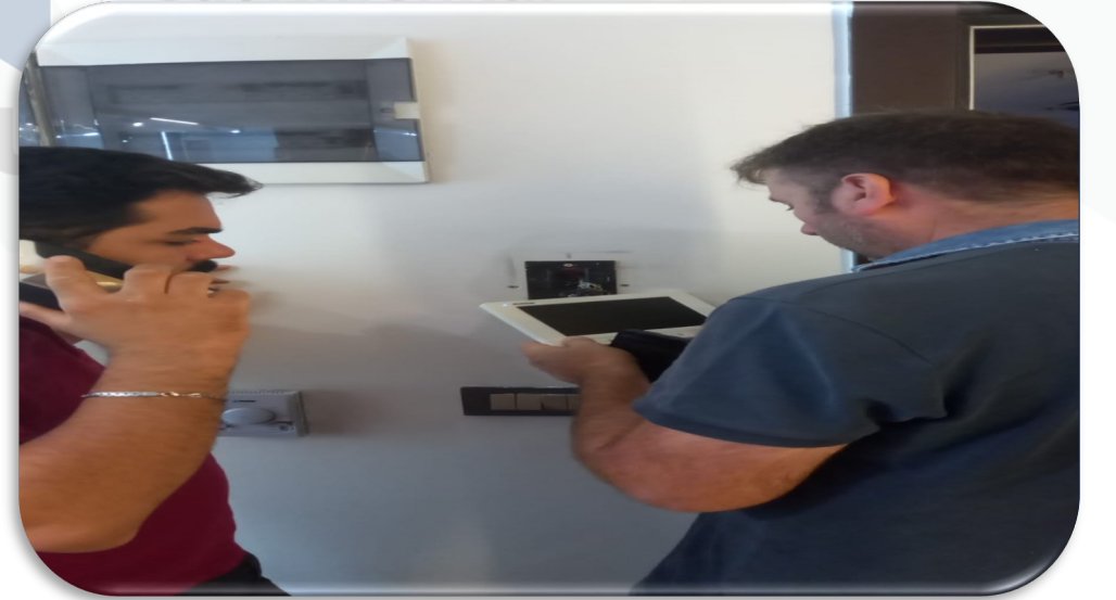
Bb lerin diyafon arıza kontrolleri gerekleŒtirilmiŒtir.