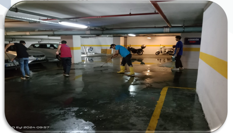
Kapalı otopark katları temizlenmiřtir.