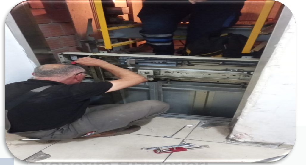
A Blok yk asansr kapı arızası giderilmiŒtir.