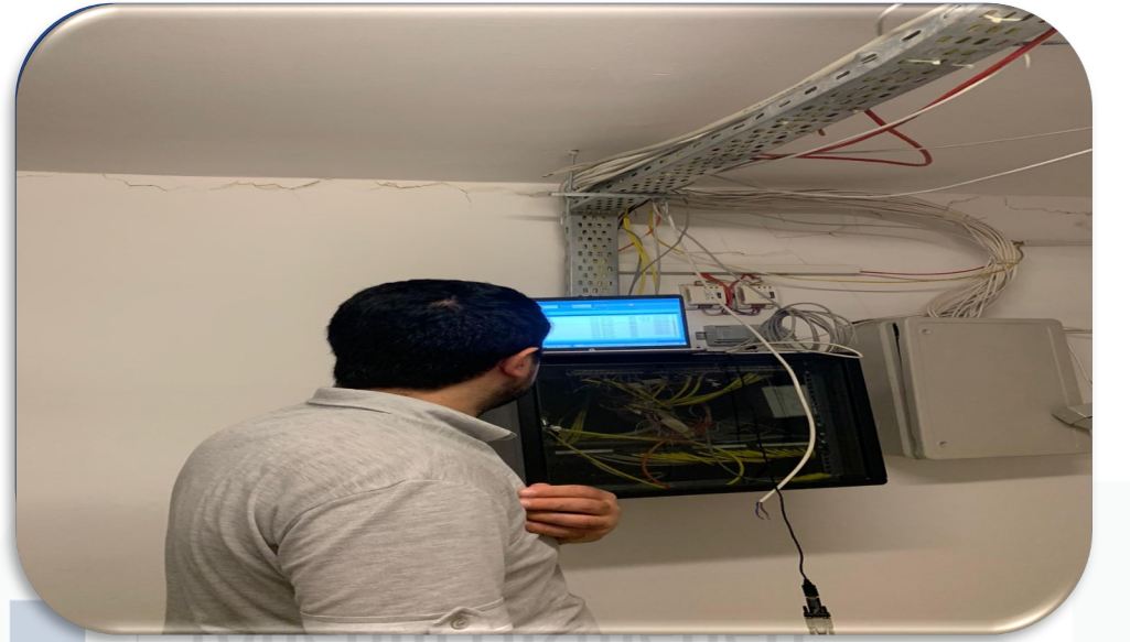
Bb'lerin süzme sayaç endeks okumaları gerçekleştirilmiştir.