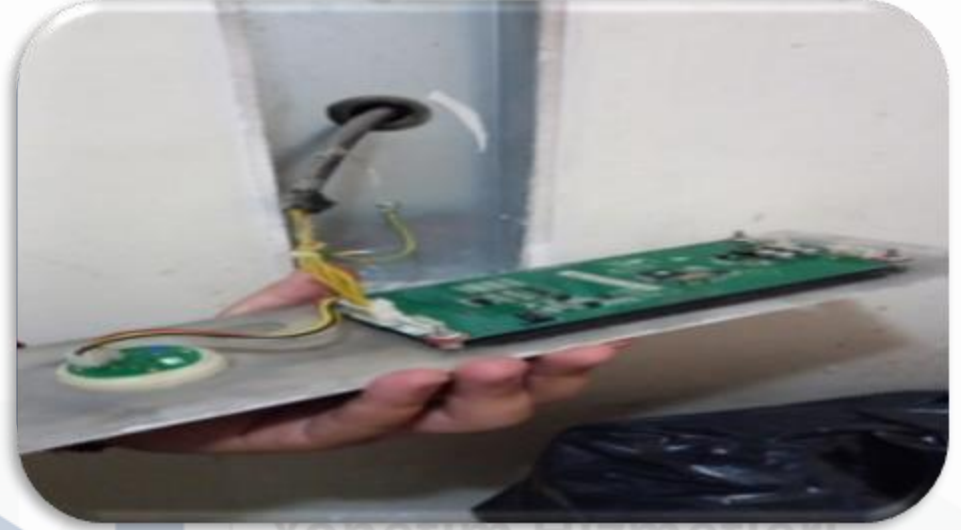
Bina geneli asansörlerin çağrı ekranlarının hasar kontrolleri sağlanmıştır.