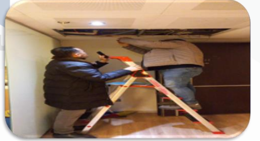
Bb süzme sayaç istasyon bakım ihtiyaçlarına ilişkin keşif sağlanmıştır.