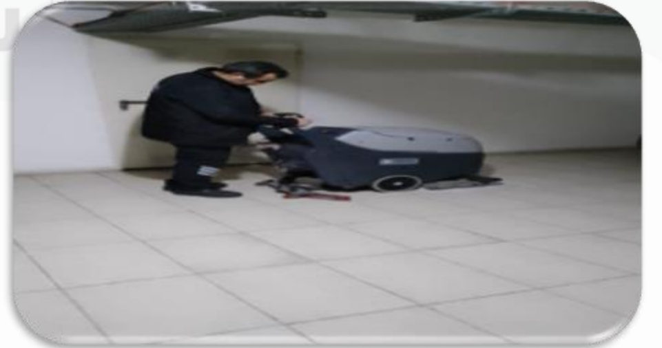
Zemin otomatı ile bina geneli kat temizlięi gerekleřtirilmiřtir.