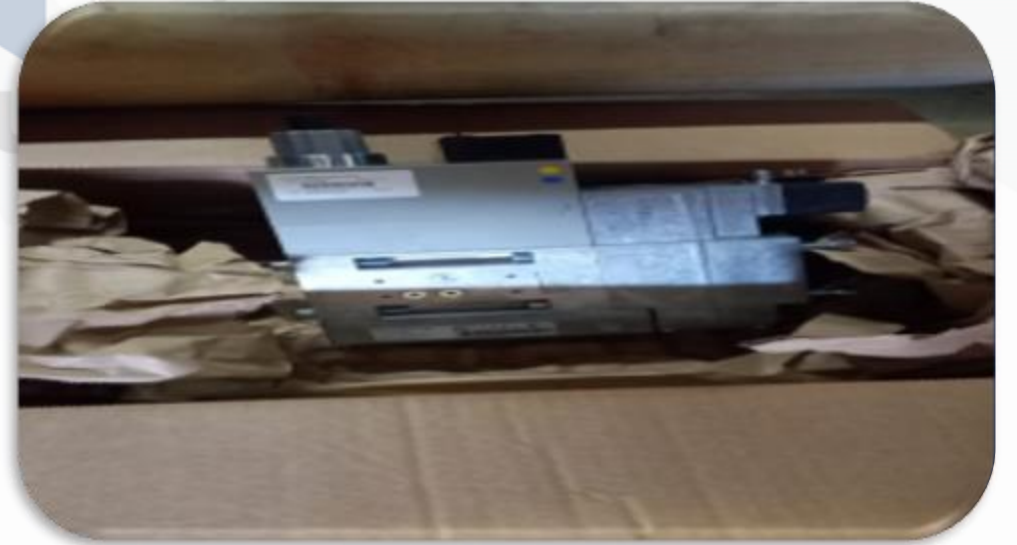
Isıtma sistemi arızalı valfi deėiŒtirilmiŒtir.