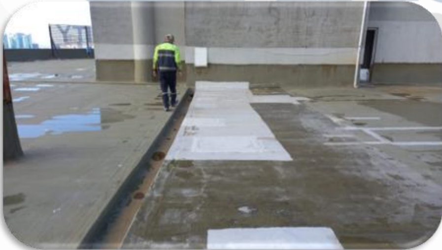
Çatı izolasyon kontrolleri sağlanmıştır.