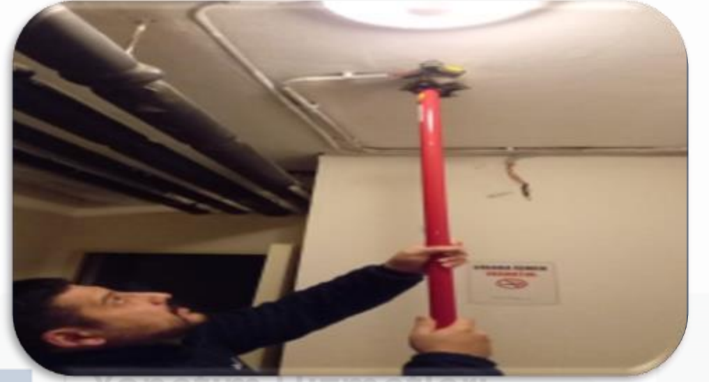
Yangın algılama sistemi periyodik kontrolleri saėlanmıŒtır.