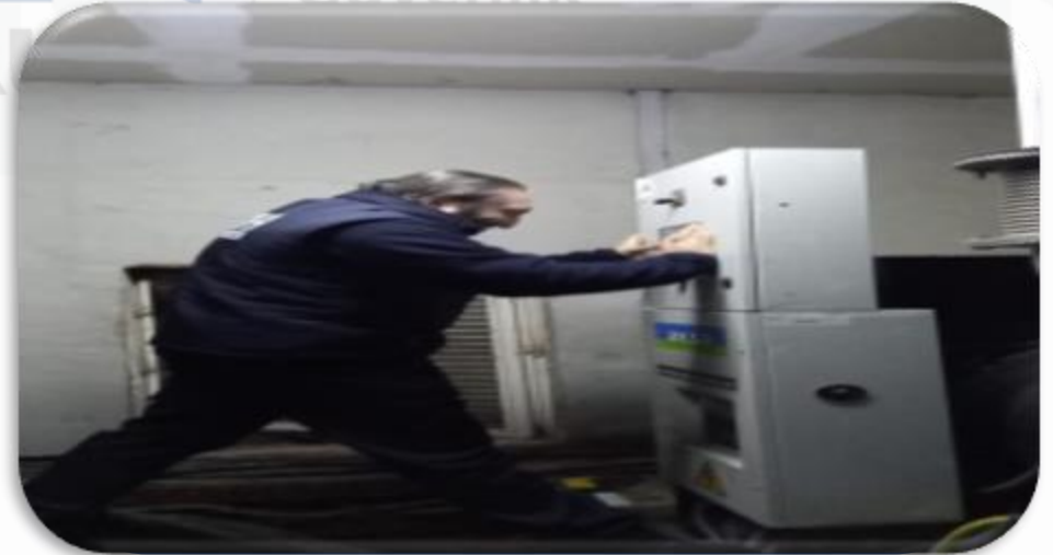
Jeneratörlerin periyodik kontrolleri gerçekleştirilmiştir.