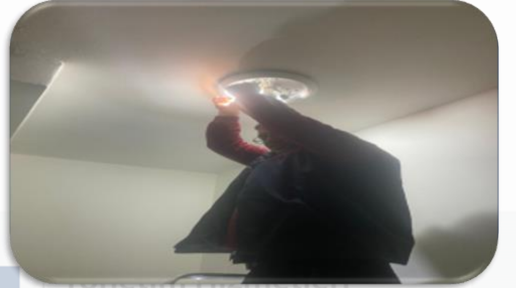
Ortak alan aydınlatma hasar kontrolleri gerçekleştirilmiştir.

➤ Isıtma sistemi periyodik kontrolleri gerçekleştirilmiştir.