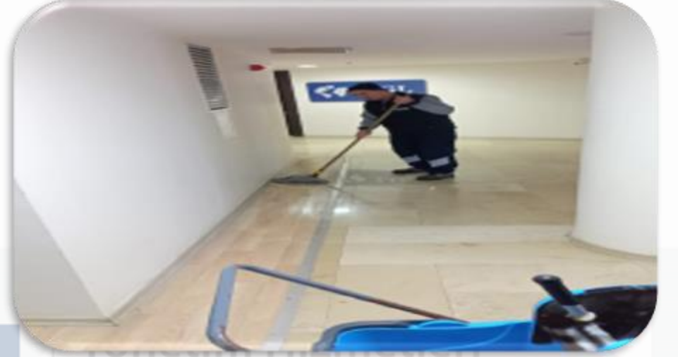
Ortak alan parke temizlięi gerekleřtirilmiřtir.