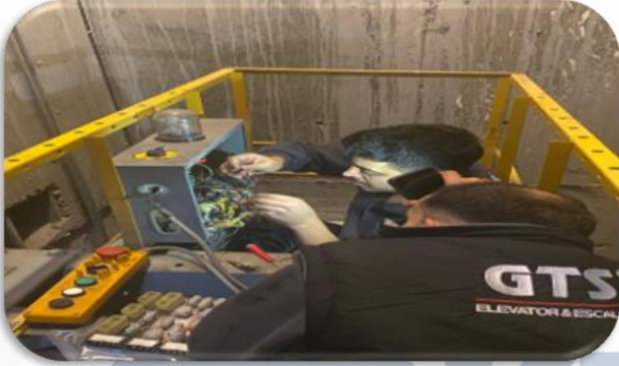
Asansörlerin aylık bakım faaliyeti gerçekleştirilmiştir.