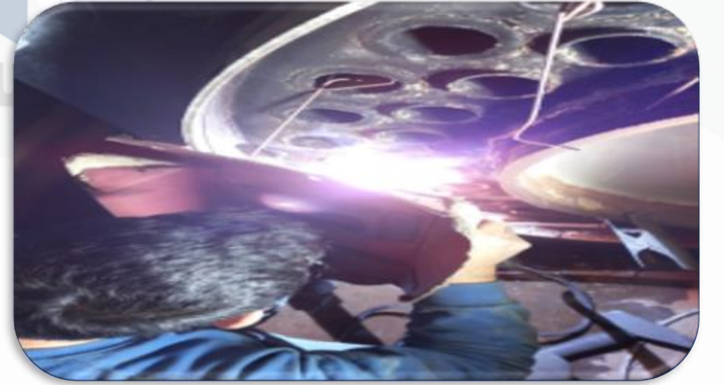
Isıtma sistemine ait boru çatlağı tamir edilmiştir.