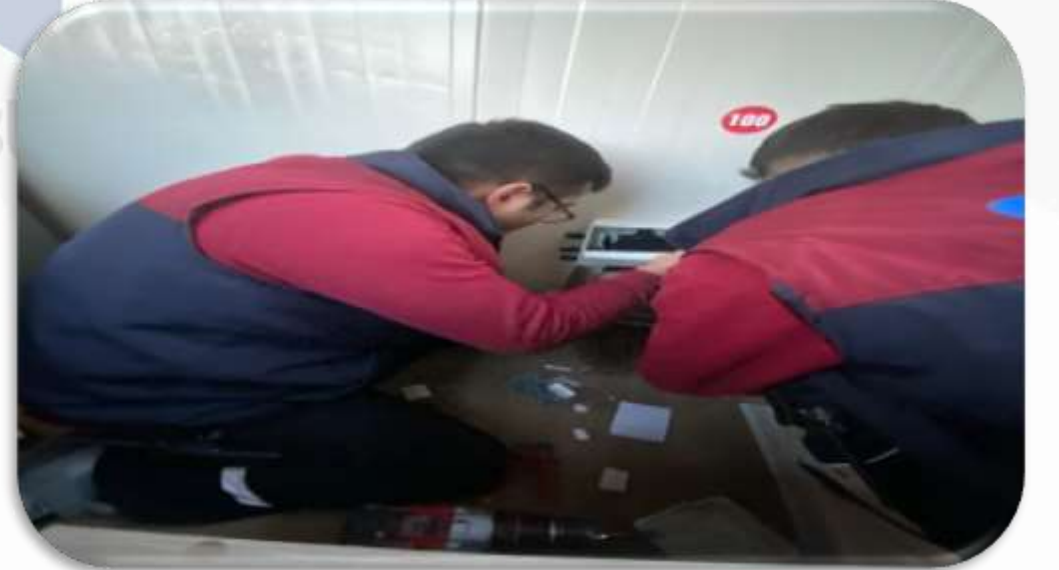
Gvenlik kabini elektrik panosu arızası giderilmiŒtir.