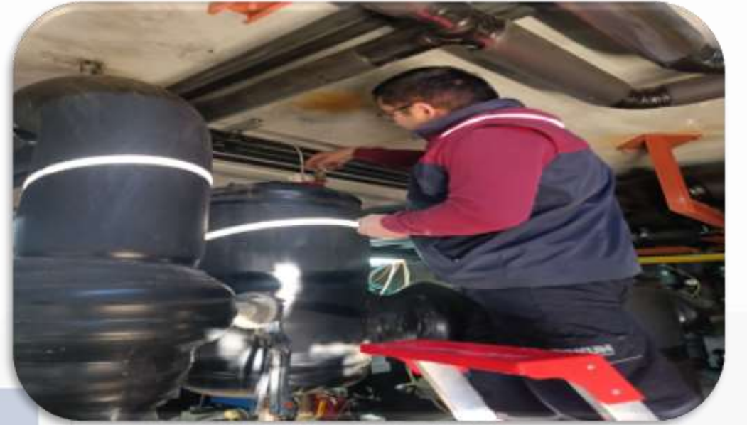
Isıtma sistemi periyodik kontrolleri gerçekleştirilmiştir.