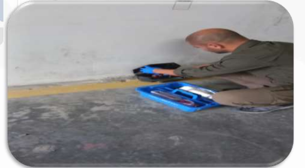
Aylık pest kontrol faaliyeti gerçekleştirilmiştir.