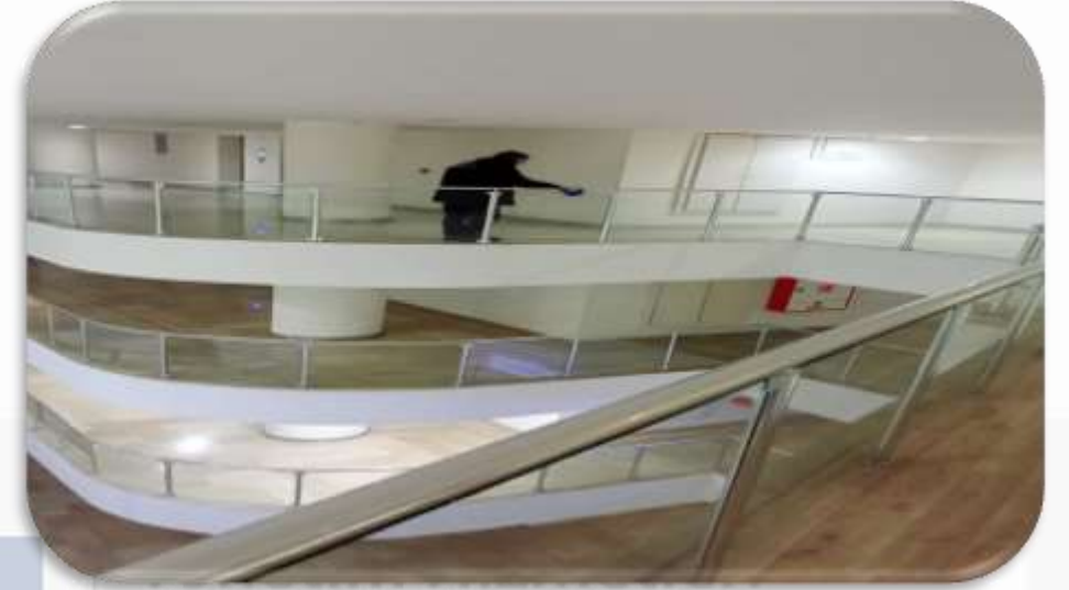
Ortak alan cam temizlięi gerekleřtirilmiřtir.