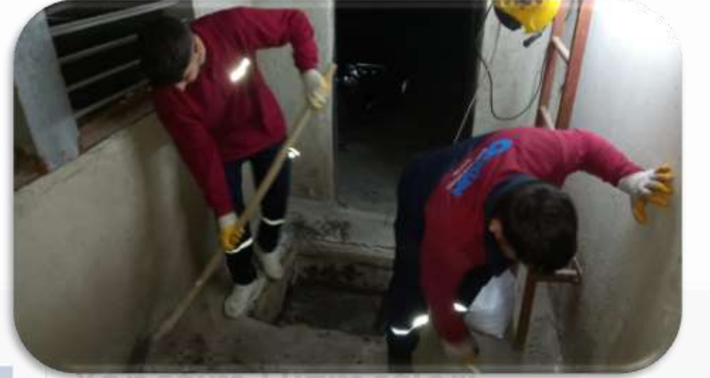
Kapalı otopark yağmur drenaj hattı kontrolleri sağlanmıştır.