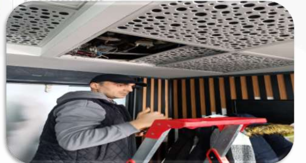
Bb süzme sayaç arıza kontrolleri gerçekleştirilmiştir.