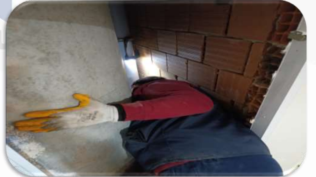
Periyodik shaft kontrolleri gerçekleştirilmiştir.