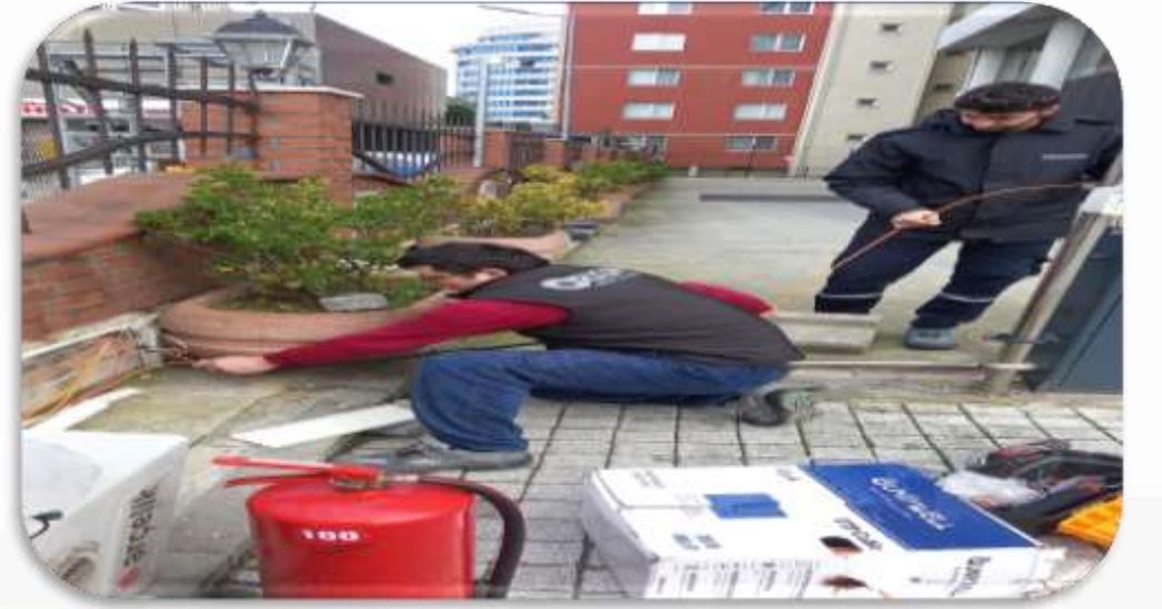
Kapalı otopark girişi PTS kablosu yenilenmiştir.