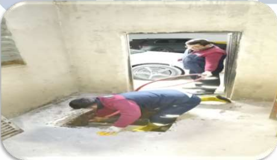
Jet fan ve havalandırma kontrolleri gerçekleştirilmiştir.