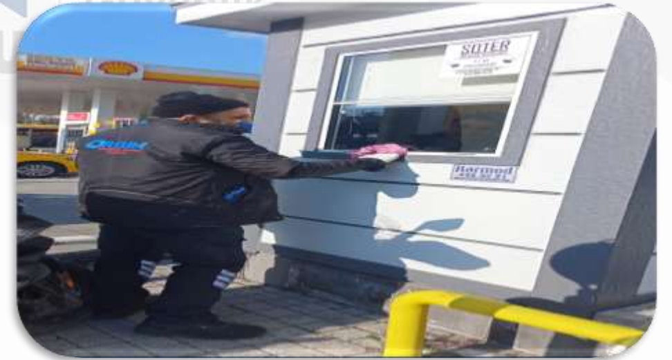
Gvenlik kabini temizlięi gerekleřtirilmiřtir.