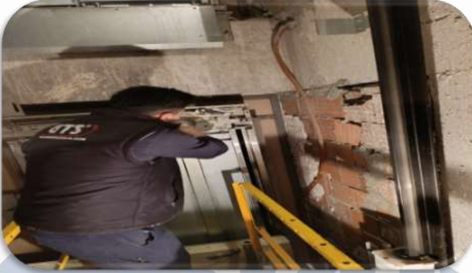
Asansörlerin aylık bakım faaliyeti gerçekleştirilmiştir.