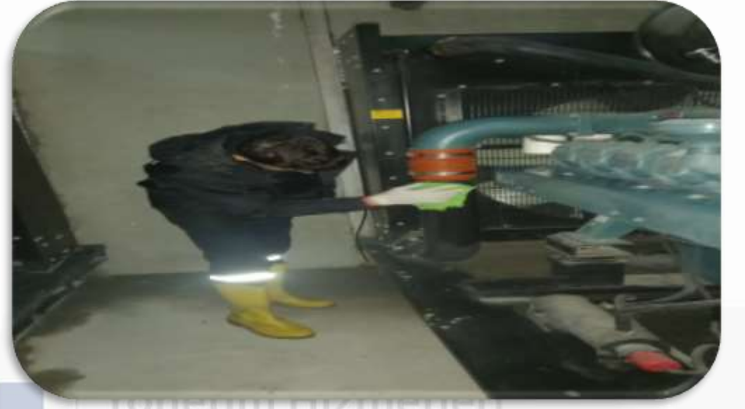
Periyodik jeneratr kontrolleri gerekleŒtirilmiŒtir.