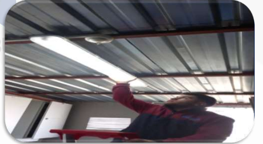
Bina geneli aydınlatma kontrolleri sağlanmıştır.